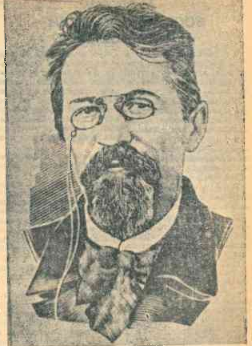
Сегодня исполняется 81 год со дня рождения (1860) замечательного русского писателя Анто́на Па́вловича Чехова. (Умер в 1904 году).