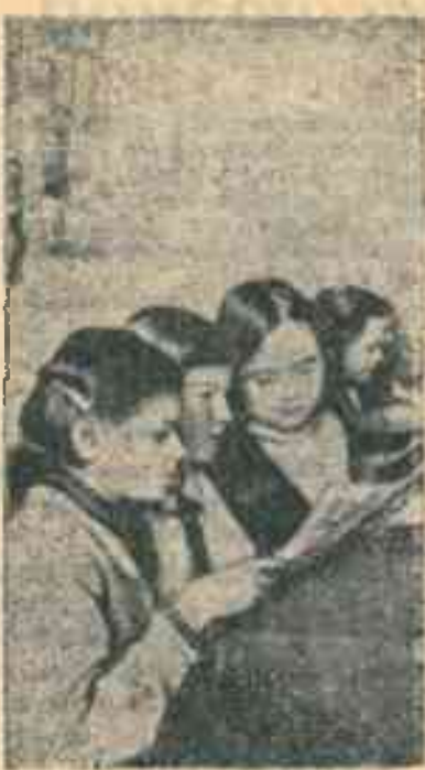
Интересная книга.

срок лечения 24 дня, для больных туберкулезом легких в закрытой форме — 30 дней, в открытой — 60 дней. Для костно-туберкулезных — 60 и 120 дней. Несколько увеличены цены на путевки по курортам Союзного значения. Цены на курсовки остались почти без изменений. Дележные санаториев на обычные и повышенные отменены. Изменился порядок получения и выдачи путевок и курсовок курортными конторами: продажа и заключение договоров с организациями производится в декабре — январе сроками на все месяцы 41 года сразу. Количество путевок для индивидуальных покупателей увеличено почти вдвое. Впервые практикуется заключение индивидуальных договоров, дающих поку-