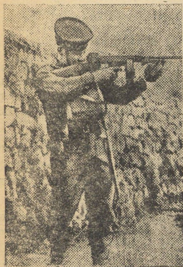
Английский солдат с автоматической винтовкой.

По сообщению американской газеты «Нью-Йорк таймс», испанские фалянгисты затеяли