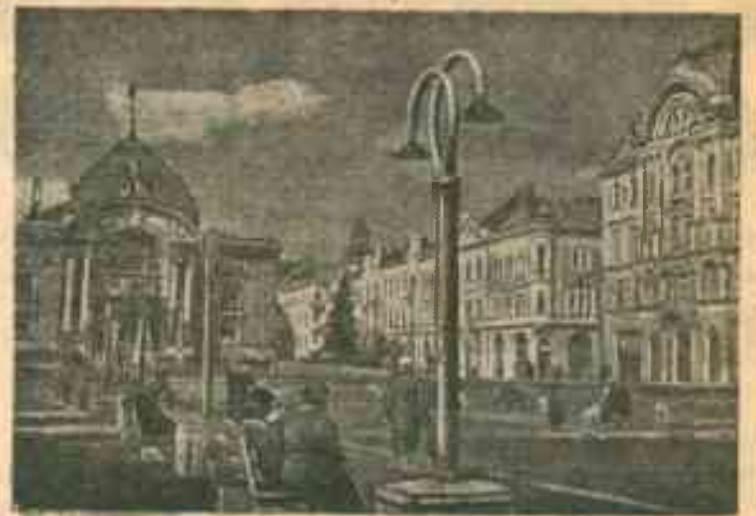
Театральная площадь в гор. Черновицах. Слева — Украинский драматический театр, справа — Дворец юных пионеров.

Студент Ленинградского Института журналистики имени Воровского.