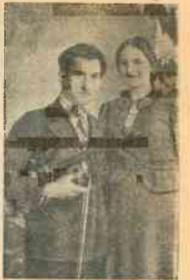
Студенты Калининского музыкального училища имени Чайковского бывшая трактористка колхоза „Ударник“...