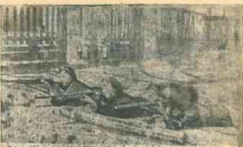
На линии огня.