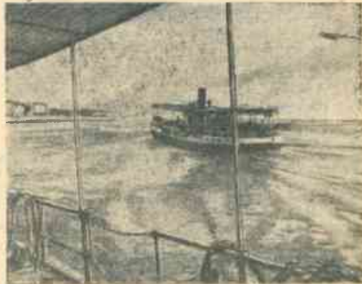
Речной трамвай на Западной Двине в районе Риги.

При советской власти свыше 52.000 безземельных и малоземельных крестьян Эстонии получили земельные наделы и прирезки. На льготных условиях им предоставлен долгосрочный кредит на приобретение скота, возведение хозяйственных построек, отпущена семенная сеуда.