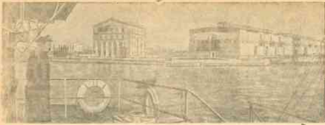
Новый речной порт столицы—Южная гавань (Московско-Одское речное пароходство).