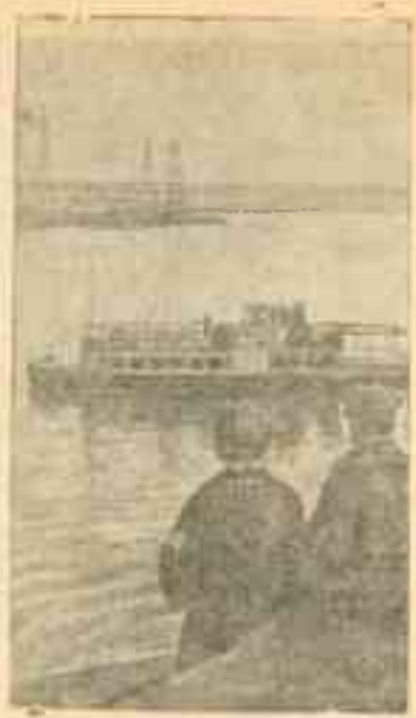
Речной трамвай на Москва-реке.