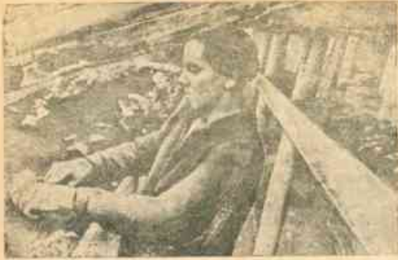
В теплице совхоза № 8.