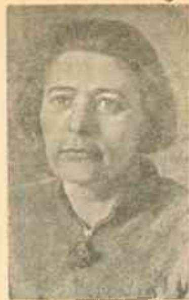
Анна Паукер — одна из активных деятелей рабочего движения в Румынии, долгое время находившаяся в заключении. В результате переговоров между правительствами СССР и Румынии тов. Паукер освобождена из тюрьмы. Она прибыла в СССР и находится в Москве.