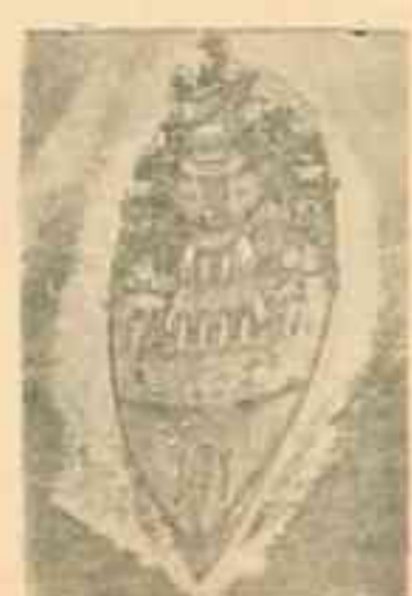
Английский мощный линкор „Георг V“ — в море.

Как передает агентство Рейтер, Черчилль не сделал в палате общин заявления об исходе переговоров представителя министерства иностранных дел Киркпатрика с Гессом. Черчилль заявил, что он сделает в палате общин соответствующее заявление, как только представится возможность. „Но, — заявил Черчилль, — выбирая момент для такого заявления, я буду руководствоваться общественными интересами“. (ТАСС).