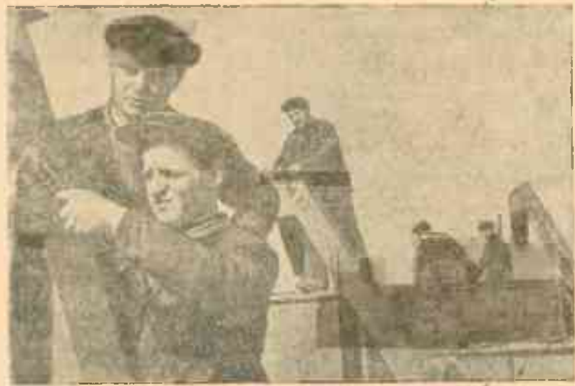
В молочном совхозе № 2 Одесского пригородного района начался подготовка к уборочной кампании.

Партийные организации всю свою агитационно-политическую работу должны перенести в поле, непосредственно в бригаду и звено. Решением постановления ЦК ВКП(б) и СНК СССР о дополнительной оплате труда колхозников, а также постановление от 13 января 1939 года о начислении в двойном размере трудовой трактористам МТС и колхозникам за первые два дня работы на раннем весеннем бороновании и за первые шесть дней на культивации и весеннем севе, нужно мобилизовать колхозные массы на успешное проведение весеннего сева, на борьбу за высокий колхозный урожай.