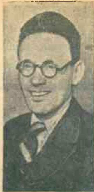
На снимке: Абсолютный чемпион СССР по шахматам 1941 г. М. М. Ботвинник. (Фото ТАСС).