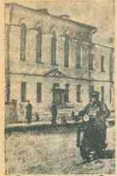
На снимке: Здание областной школы среднего сельскохозяйственного образования в г. В.-Устюге.

Валя УГЛОВСКАЯ. Ученица 4 "а" класса начальной школы № 1