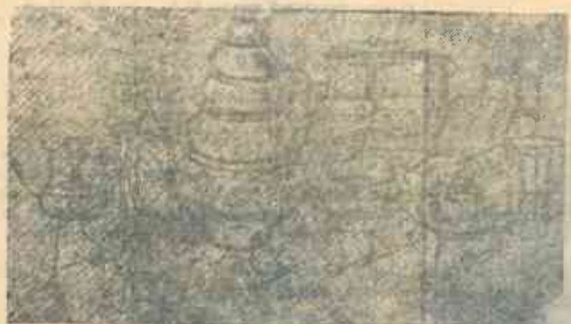
В цехах ширпотреба, в кустарных артелях Умножится выпуск полезных изделий