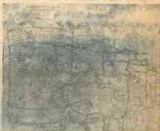
Мой замысел прост. Мой замысел смел. Две тысячи листов для нас не предел.