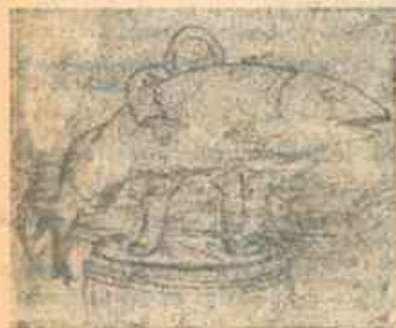
В кухни, столовые и магазины Просятся щуки, лещи и язи.