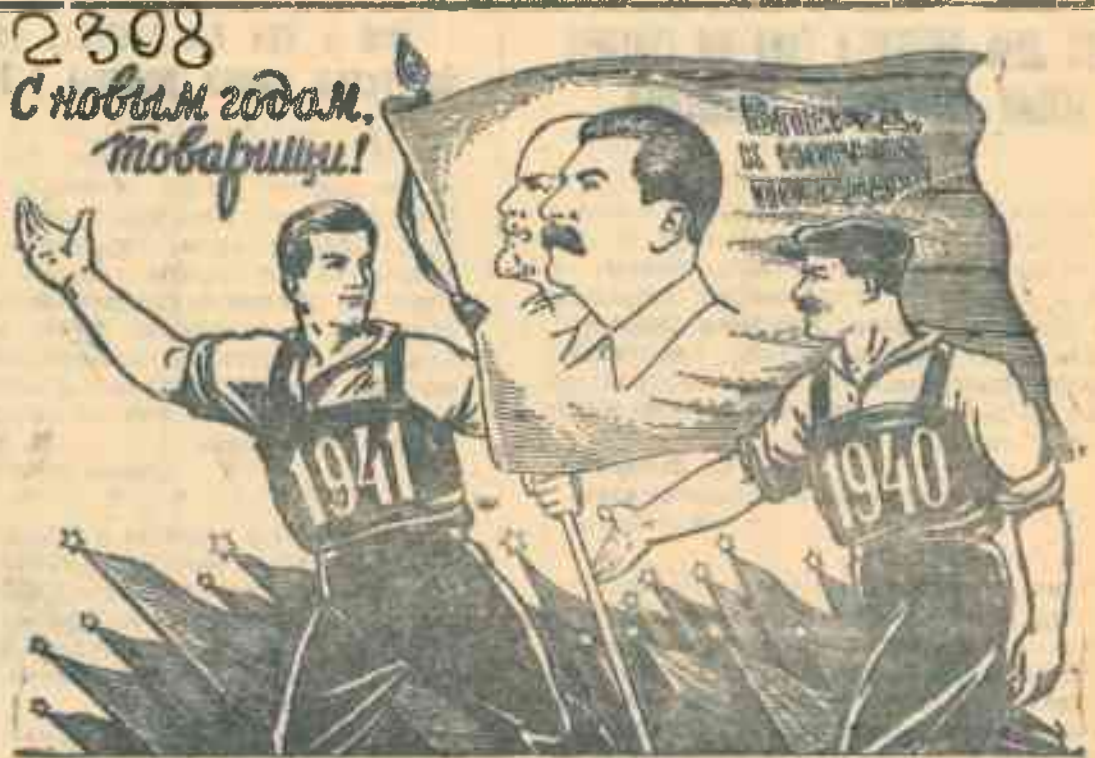
Рис. В. Баркова и В. Лисевича.

Сложная международная обстановка обязывает каждого из нас на своем посту вкладывать всю энергию и волю, все знания, способности и силы на укрепление могущества нашей родины, идущей под мудрым водительством великого Сталина вперед, к коммунизму. С новым счастливым годом, товарищи!