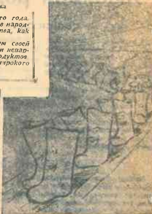
Нашим бойцам, лесорубам, полярникам— Всем, кто трудится на благо страны Больше заготовьте валенок, Теплые валенки многим нужны!