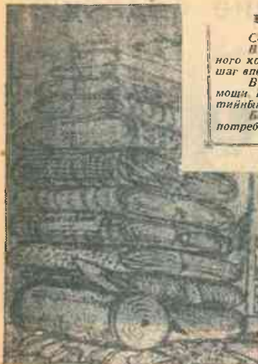
Много добротных полотен и тканей Наши красавицы родине дали. Много стране и в новом году Лучшего качества тканей дадут.

Сорван последний лист календаря. Год 1940 ушел. Сегодня первый день нового года. В историю советского народа минувший год войдет, как год больших успехов народного хозяйства, как торжество мудрой внешней политики советского правительства, как шаг вперед под знаменами партии Ленина—Сталина к коммунизму. В новом, 1941 году наша страна будет работать над дальнейшим укреплением своей мощи перед промышленностью, сельским хозяйством, перед каждым партийным и непартийным большевиком стоит задача—дать стране как можно больше товаров и продуктов. Больше леса, хлеба, тканей, больше молока, мяса, масла, больше предметов широкого потребления!