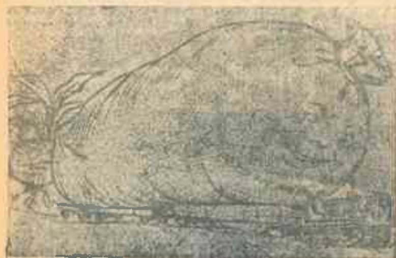
Не будет конца и краю Колхозному урожаю