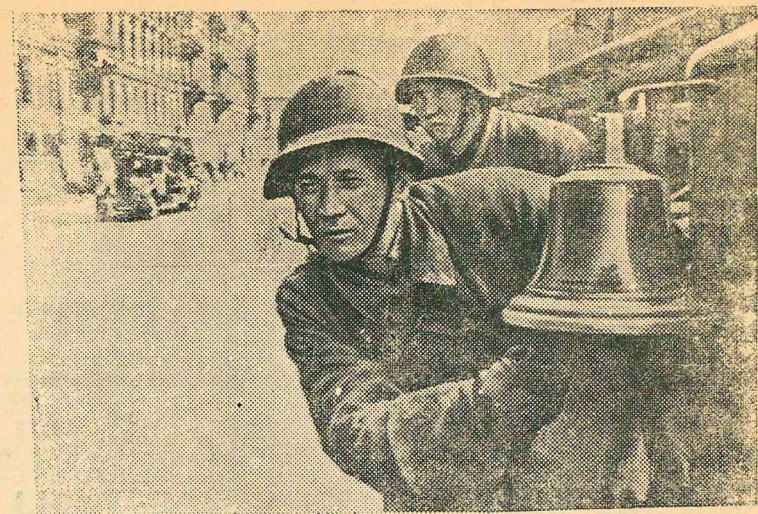
Указом Президиума Верховного Совета СССР Ленинградская пожарная охрана НКВД награждена орденом Ленина. На снимке: машины пожарной охраны выехали по боевой тревоге.

□ Южнее Воронежа, на западном берегу Дона, противник силою до 2 батальонов пехоты при поддержке танков атаковал наши позиции, атаки противника были отбиты огнем нашей артиллерии. Уничтожены минометная и 4 артиллерийских батареи, 10 пулеметов, 68 повозок с боеприпасами и до роты пехоты противника.