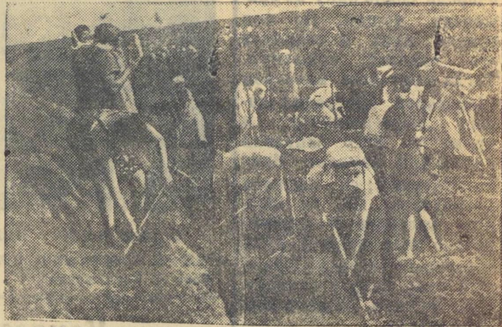
В прифронтовой полосе.

В Баренцовом море захвачена немецкая подводная лодка „У-73“.