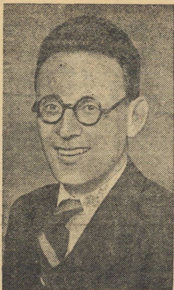
На снимке: абсолютный чемпион Советского Союза по шахматам гроссмейстер М. М. Ботвинник.