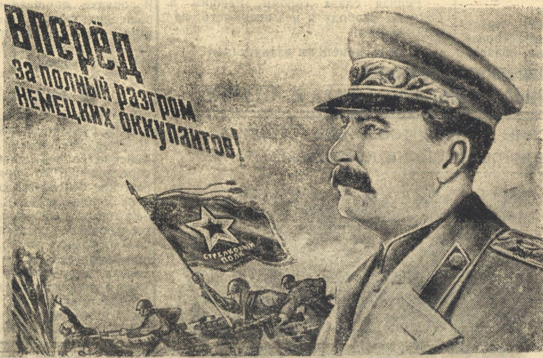
Рис. худ. Н. Долгорукова.

Успехи Красной Армии стали возможными благодаря правильной стратегии и тактике советского командования, благодаря высокому моральному духу и наступательному порыву наших бойцов и командиров, благодаря хорошему оснащению наших войск первоклассной советской военной техникой, благодаря возросшему искусству и выучке наших артиллеристов, минометчиков, танки-