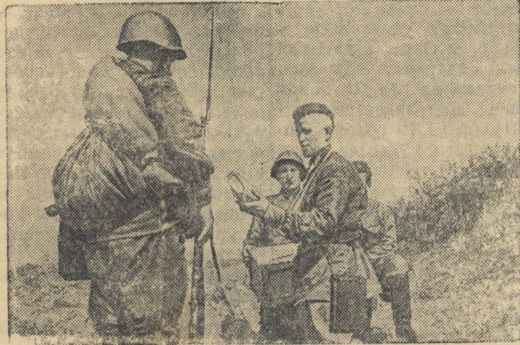
Раздача подарков от трудящихся бойцам на передовых позициях. (Западное направление).