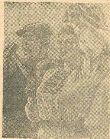
Красной Армии-победительнице—ЧЕСТЬ и СЛАВА! Рисунок художника В. Иванова.