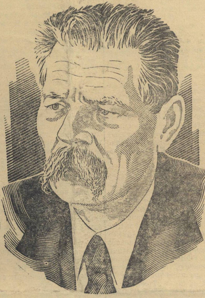
Алексей Максимович Горький. Рисун ок Г. Теодоровича