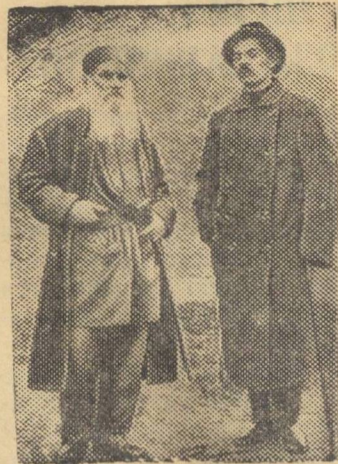
На снимке: Л. Н. Толстой и А. М. Горький.

Нового героя — представителя класса, несущего ос-