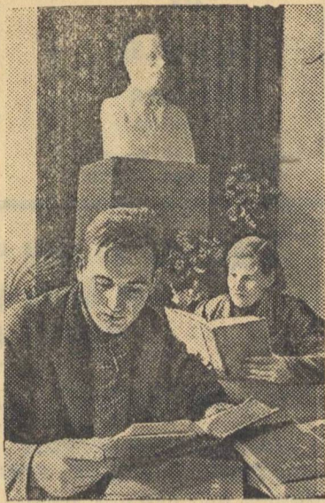
При Рижском уездном комитете КП(б) Латвии организован парткабинет и библиотека.

Секретарь парт-организации при леспромпхозе.