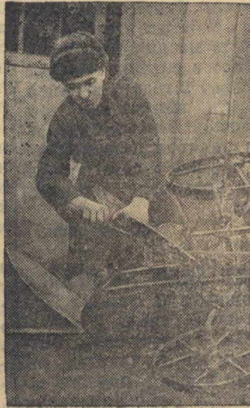
Участник ВСХВ 1940 года колхозимени Коминтерна (Моршанский район, Тамбовская область) выдвигнут кандидатом на выставку 1941 года.

Председатель исполкома Пожарского сельсовета.