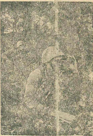
На снимке: разведчики И-ского полка под командой младшего лейтенанта М. В. Сингаевского (впереди) пробиваются к позиции противника.