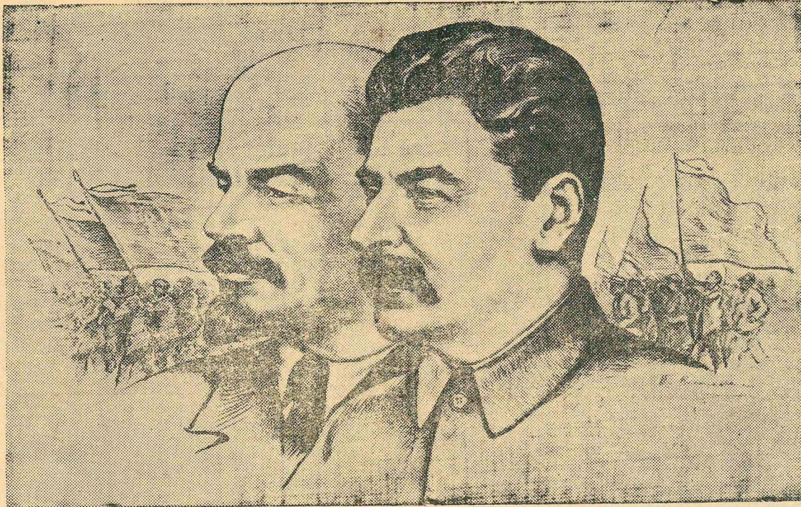
В. И. Ленин и И. В. Сталин.

Товарищ Сталин учит нас настойчиво овладевать марксизмом-ленинизмом. Он постоянно обогащает это великое учение. Исключительная роль в развитии и пропаганде марксизма-ленинизма книги Сталина „Вопросы ленинизма“ и „Краткого курса истории ВКП(б)“. За 1926—1940 годы „Вопросы ленинизма“ изданы в СССР на 37 языках общим тиражом свыше 14 миллионов экземпляров. Великая сталинская книга—„Краткий курс истории ВКП(б)“—за два года издана у нас на 57 языках тиражом свыше 16,5 миллиона экземпляров. Пожалуй, ни одна книжка в мире не