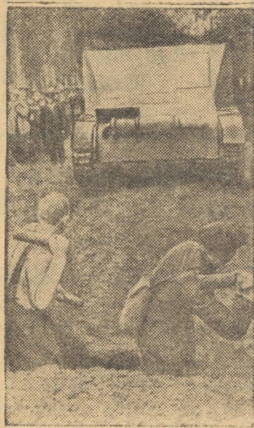
Ленинградцы встают на защиту своего города.