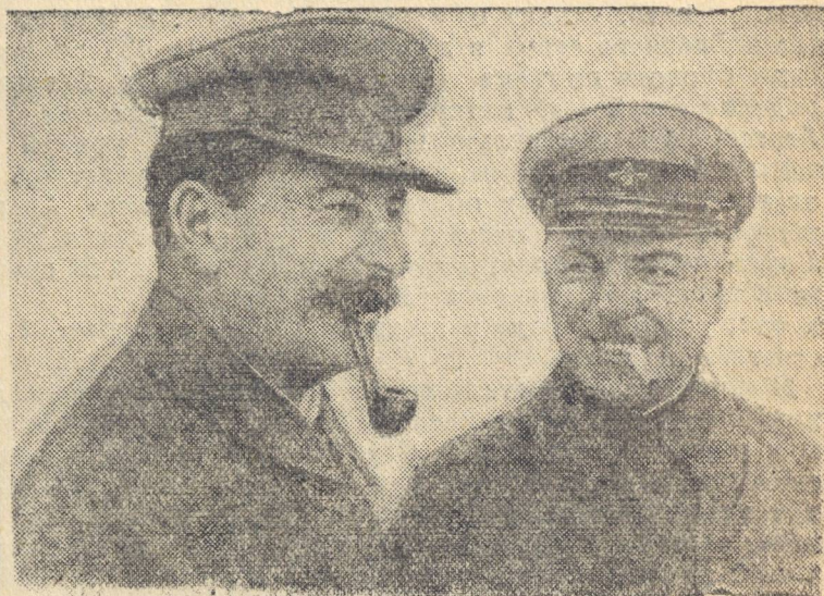
И. В. Сталин и К. Е. Ворошилов (1935 г.).

пелвать свои обязательства по поставке молока государству маслом. При сдаче масла вместо молока засчитывать в выполнение обязательств: а) Один килограмм масла топленого с содержанием в нем жира не менее 95 проц. вместо 25 литров молока. б) Один килограмм сливочного масла (сырца) с содержанием в нем жира не менее 75 проц. вместо 19 литров молока.