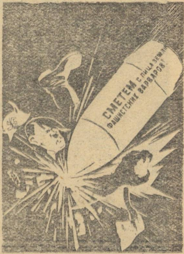
Рисунок художника Н. Долгорукова.

мобилизованный рабочий райпищепромкомбината.