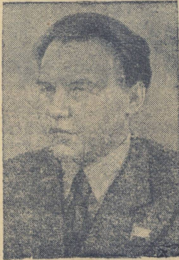
Кандидат в члены Политбюро ЦК ВКП(б). Тов. Н. А. ВОЗНЕСЕНСКИЙ