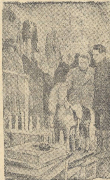
На выставке изделий, изготовленных на местном сырье Чапаевской областной промышленности. Посетители выставки осматривают товары широкого потребления.