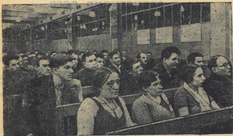
Отчетно-выборные собрания цеховых партийных организаций на заводе имени Сталина (Москва). Партсобрание в литейном цехе № 3.