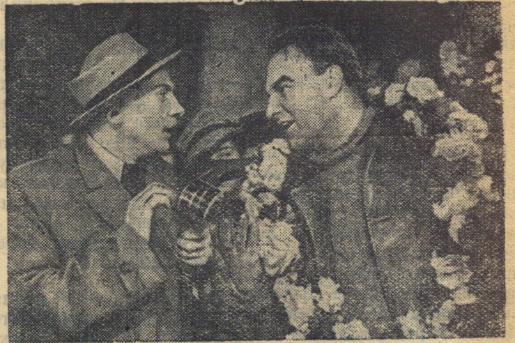
Момент встречи В. Чкалова на американском аэродроме. Репортер американской радиоконстанции (артист Г. Клеринг) берет интервью у В. Чкалова (артист В. Белокуров).