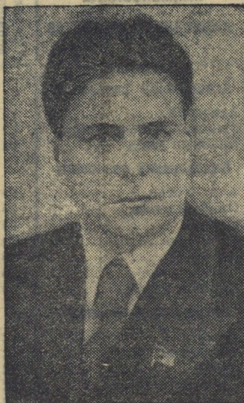
Председатель Совнаркома Карело-Финской ССР П. С. Проконев