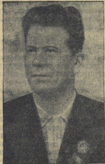
Первый секретарь ЦК КП(б) Карело-Финской ССР Г. Н. Куприянов