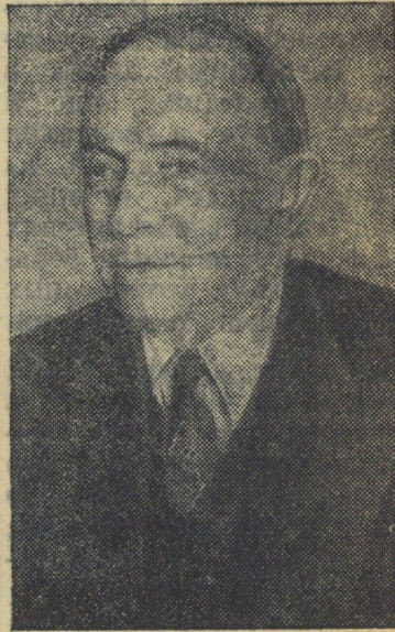
Председатель Президиума Верховного Совета Карело-Финской ССР О. В. Куусинен