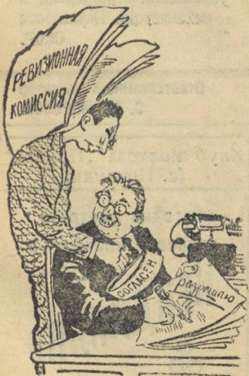
Ангел-хранитель. Рис. В. Баркова и В. Лтшеви-

Бережь народную копейку или как не надо работать ревизион- ным комиссиям.