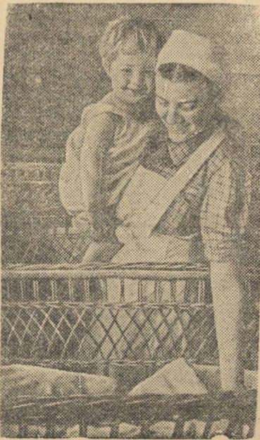
В новых детских яслях № 1 в гор. Каунасе.

С установлением Советской власти в Литве введено социальное страхование, бесплатная медицинская помощь. Открываются десятки новых детских яслей, детских садов, поликлиник, амбулаторий, родильных домов и т. д.