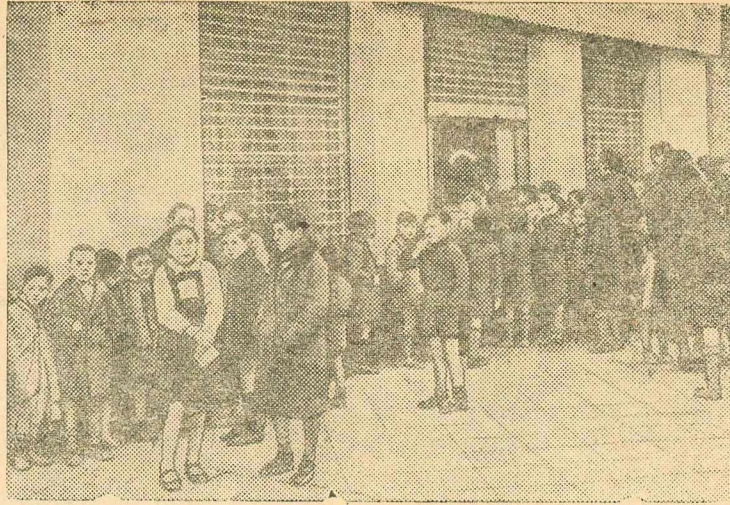
В ожидании очередного пайка в Испании.

Партия требует четкой работы транспорта — и железнодорожного и водного. Выполнение и перевыполнение плана перевозок будет оплотнением хозяйственной мощи нашей родины.