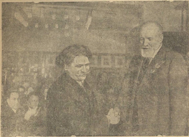
Председатель Комитета по Сталинским премиям в области литературы и искусства В. И. Немирович-Данченко поздравляет писателя С. Н. Сергеева-Ценского.

21 и 22 апреля в Москве состоялось вручение дипломов и денежных премий лауреатам Сталинской премии—деятелям науки, изобретательства, искусства и литературы.