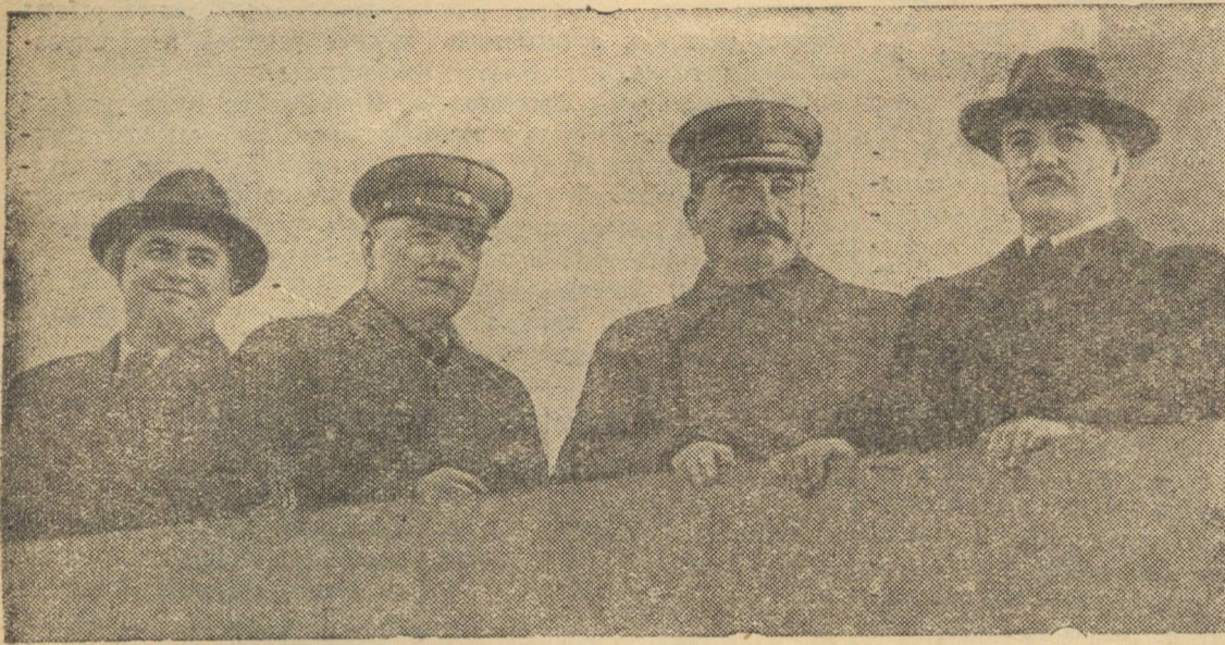
Справа налево: товарищи В. М. Молотов, И. В. Сталин, К. Е. Ворошилов, и Г. М. Димитров на трибуне мавзолея.