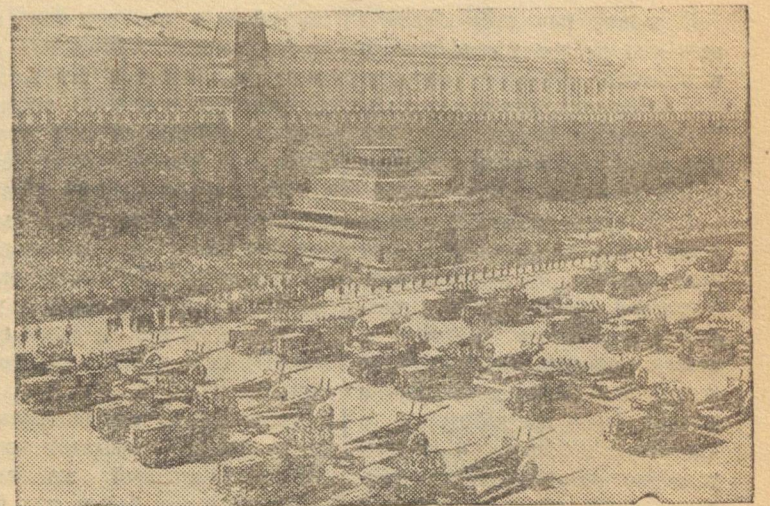
Парад войск на Красной площади. Артиллерия на параде.