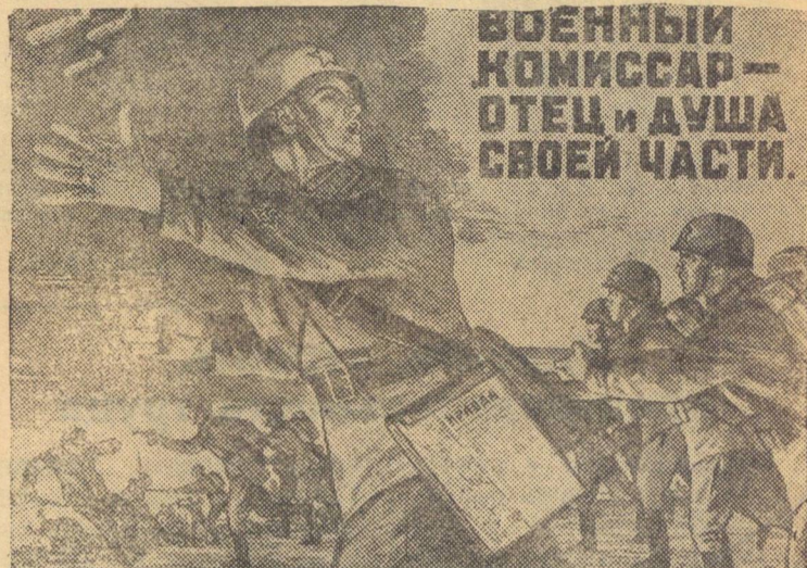
Рисунок художника Мальцева. (Репродукция с плаката, выпускаемого издательством „Искусство“).