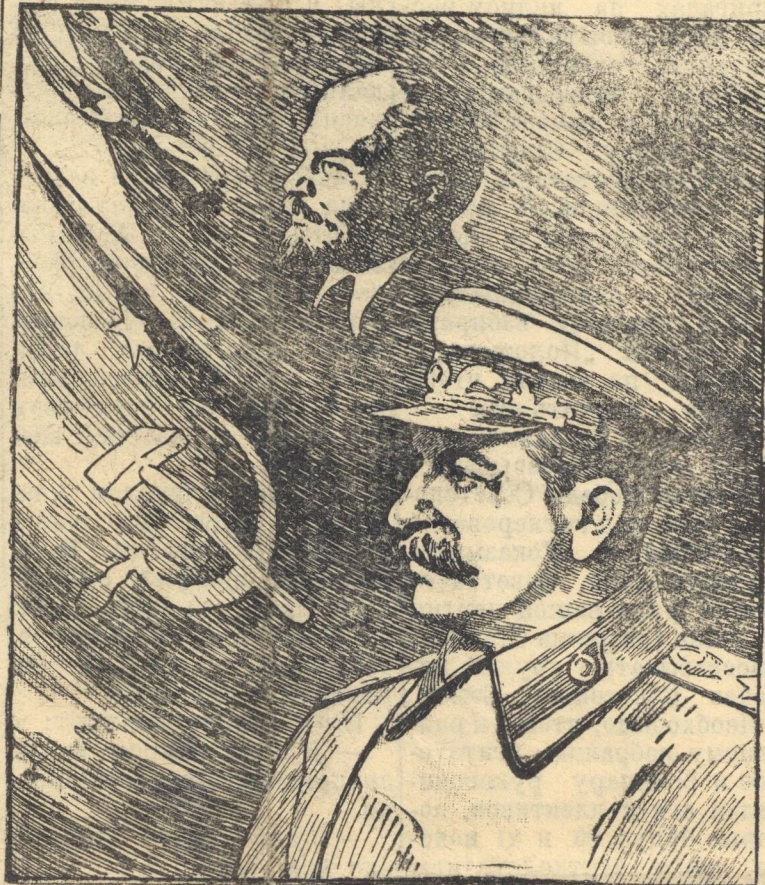
Под знаменем Ленина, под водительством Сталина — вперед к новым победам!

Да здравствует вождь и родной отец — мудрый Сталин!