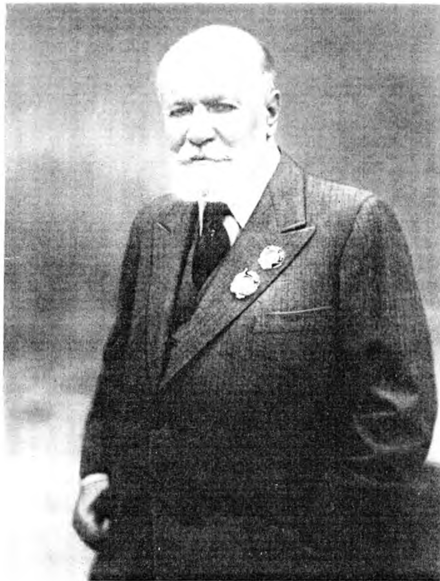
Владимир Иванович Немирович-Данченко