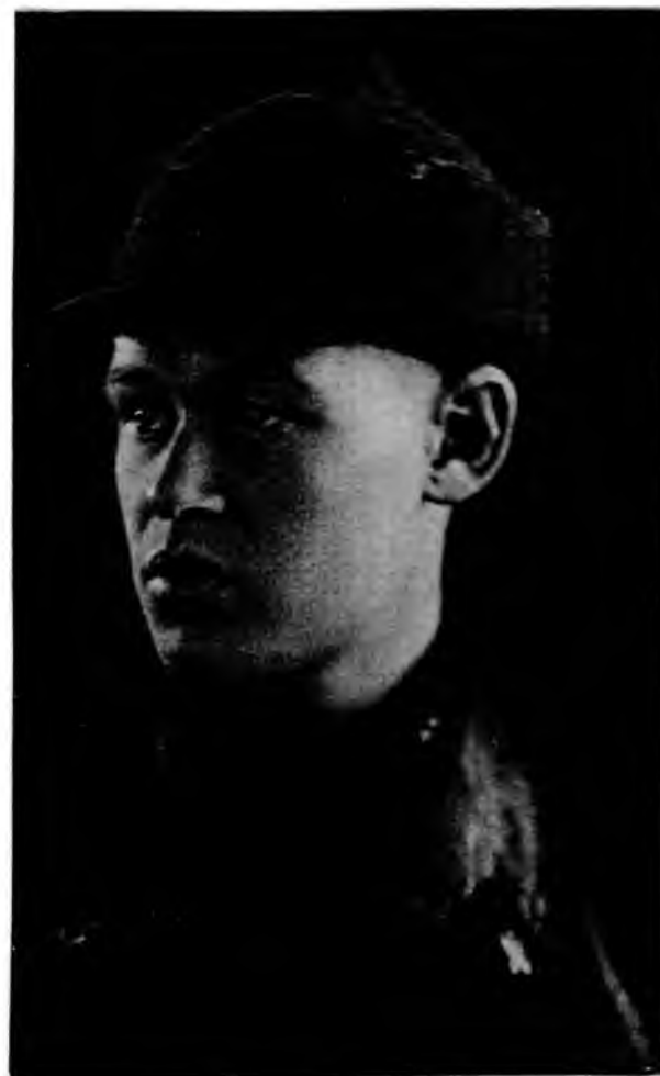
Владимир Владимирович Герман в феврале 1932 года в Ленинграде