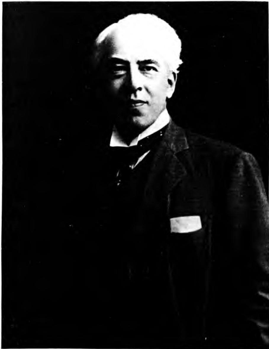
Константин Сергеевич Станиславский