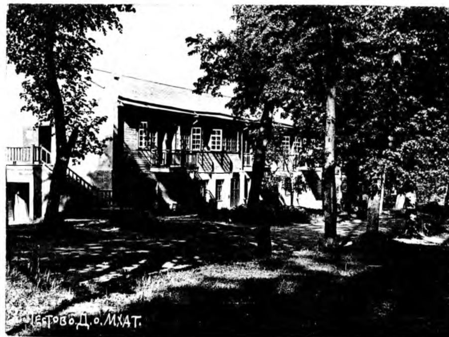
Вверху: «Белый» дом, внизу «Желтый»