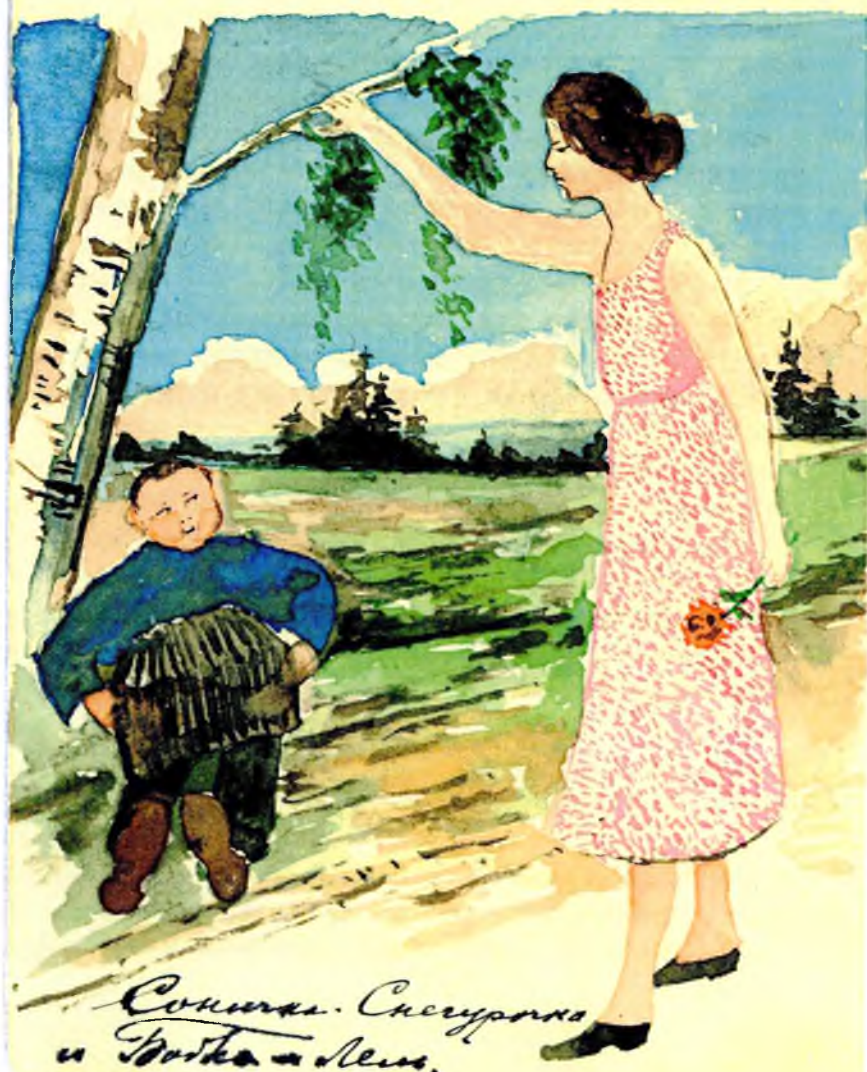
Сонина. Сисуронна и Готка - Мус.