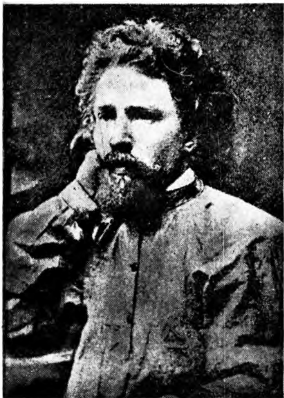
ЗАСОДИМСКИЙ Павел Владимирович