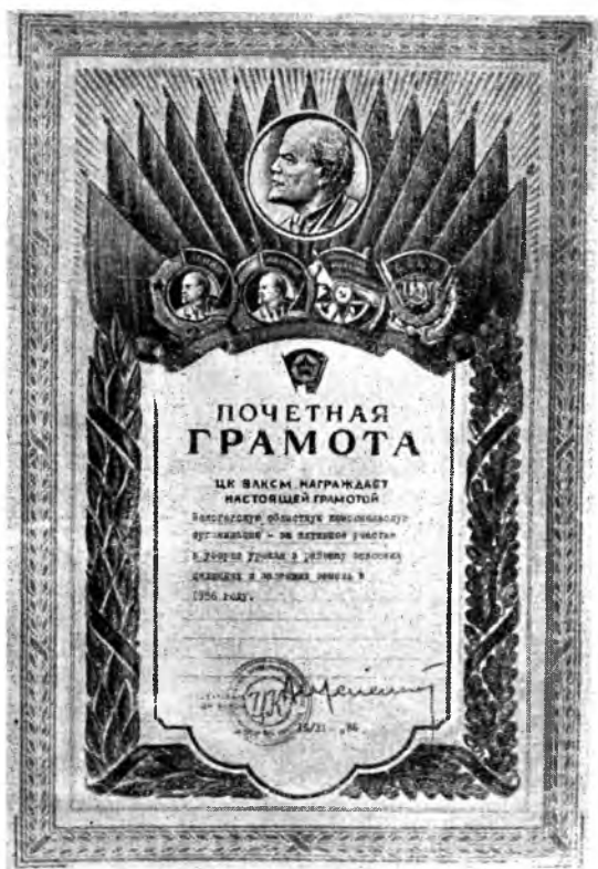
Почетная грамота ЦК ВЛКСМ Вологодской областной комсомольской организации за активное участие в уборке урожая на целине в 1956 году.

лодежные бригады. Если в 1954 году таких бригад было только 9, то в 1957 году их уже стало 27. Молодые доярки соревнуются за получение 2200 килограммов молока от каждой коровы. Победителям социалистического соревнования ежемесячно вручаются переходящие вымпелы райкома ВЛКСМ. Молодые труженики полны решимости выполнить взятые обязательства.