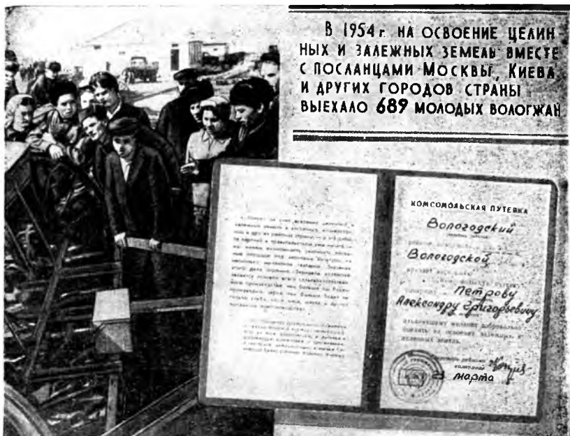
В целинном совхозе.

района разнеслась слава об успехах молодых тружеников колхоза «Передовой». Почти двухмиллионный доход получил за год этот колхоз. И в этом несомненная заслуга молодежи. Полеводческими бригадами здесь руководят комсомолцы. Молодые колхозники выращивают лен, ухаживают за животными. Надой коров значительно повысился. Каждый гектар посевов льна дал по 10 тысяч рублей дохода. А средний урожай зерновых составил 50—60 пудов с гектара. Богатым стал и трудодень — 1 килограмм 700 граммов зерна и свыше 5 рублей деньгами.