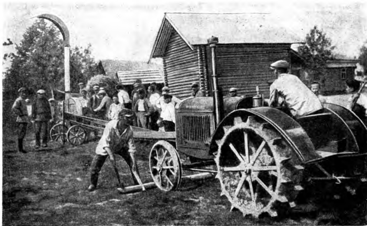
Первый трактор в колхозе «Труд», Вологодского района. 1930 г.