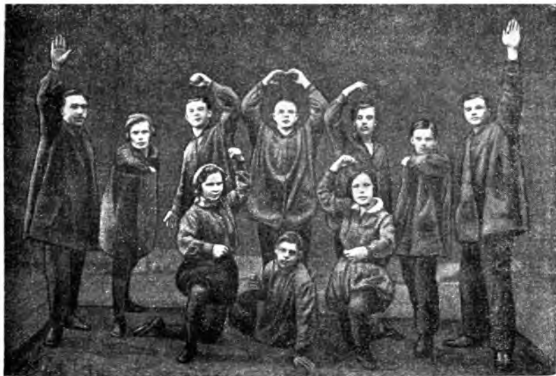
Выступление группы синемлузников гор. Вологды.

В 1939 году грамотные составили 89 процентов всего населения СССР в возрасте от 9 до 49 лет. Миллионам трудящихся была дана не только элементарная грамотность, но и открыт путь для дальнейшего культурного и политического роста.