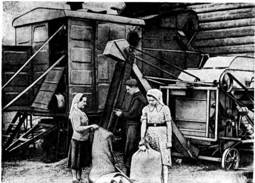
Молодые хлеборобы колхоза «Память Ильича», Лежского района, на сортировке зерна.

Комсомольцы совхоза «Плоское», этого же района, создали звено высокого урожая, контрольные посты на животноводческих фермах, приступили к работе по заготовке и вывозке на поля местных удобрений.