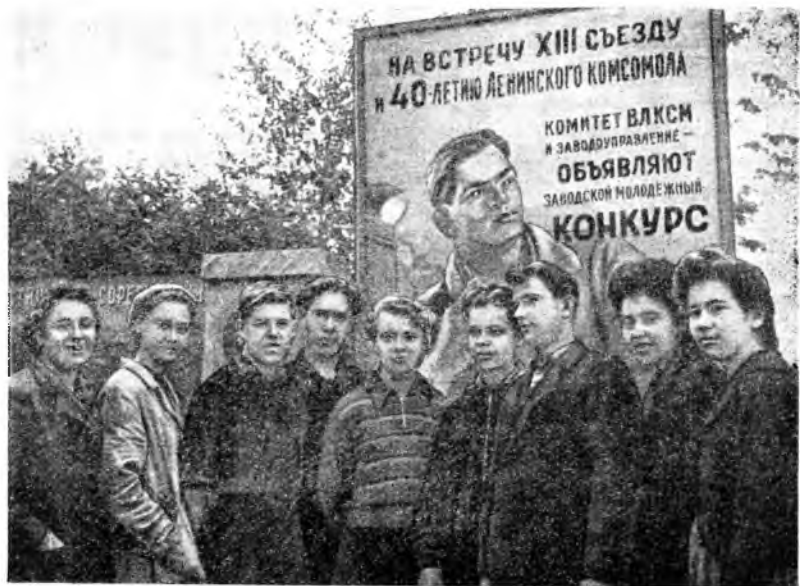
Группа комсомольцев ВПВРЗ, пришедшая на производство после окончания средней школы.

Абсолютное большинство советской молодежи, следуя ленинскому завету, не мыслит свою жизнь без труда на благо Родины.