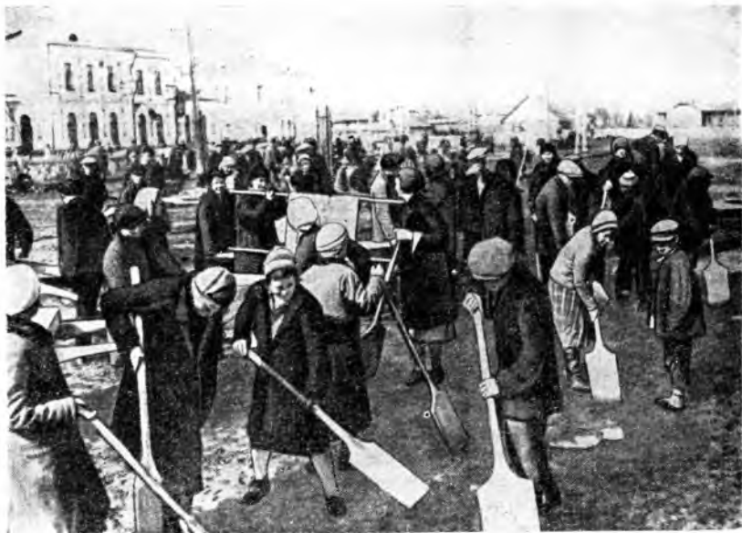
Субботник молодежи по разбивке сквера на пл. Шмидта в гор. Вологде в 1930 году.

О понимании комсомольцами-вологжанами своей роли свидетельствует, например, такой документ-резолюция: