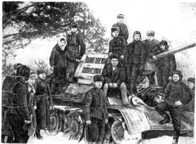
Передача советским воинам танковой колонны «Вологодский колхозник».

гельство танковой колонны «Вологодский колхозник» 67 миллионов рублей и на авиасоединение «Героическому Ленинграду» — 25 миллионов рублей. Делегации трудящихся области, в составе которых были и представители комсомола, выезжали на фронт для вручения боевых машин славным защитникам Родины.