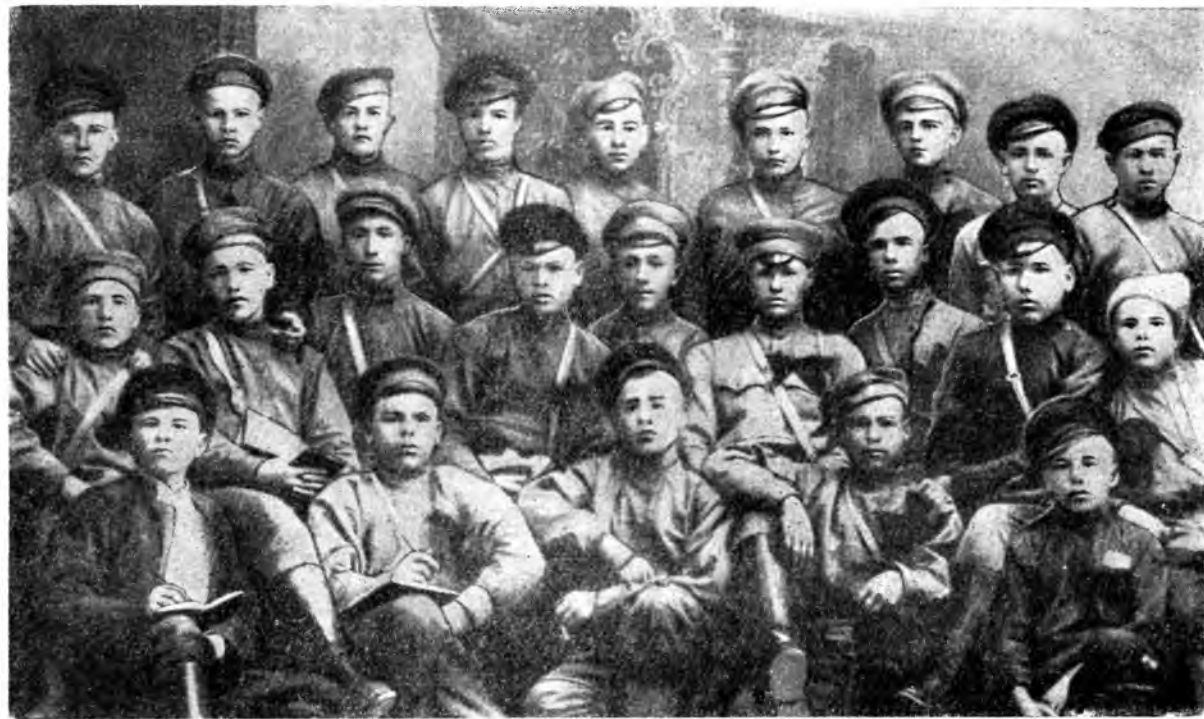
Отряд тотемских комсомольцев перед отправкой на фронт.