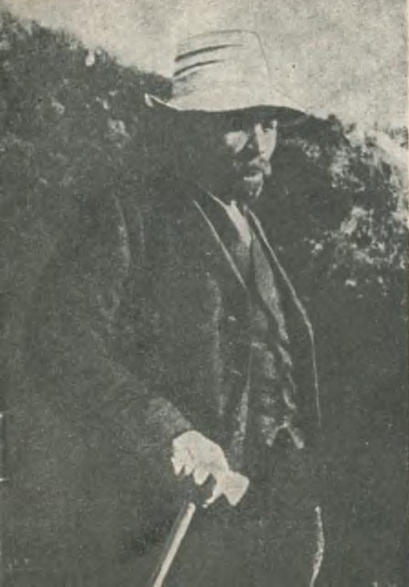
В. И. Ленин в Поронино.