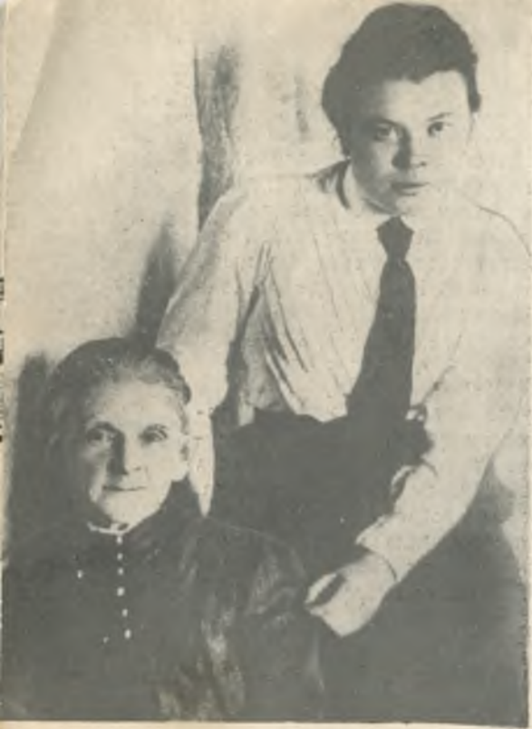
Мария Ильинична Ульянова с матерью Марией Александровной. Вологда, 1913 год.