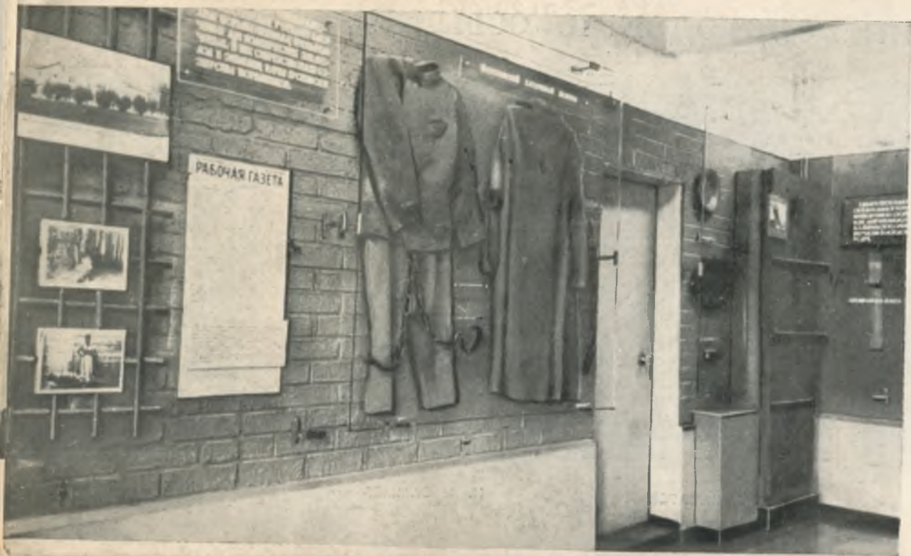
В экспозиционном зале музея.