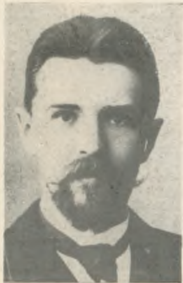
В. В. ВОРОВСКИЙ