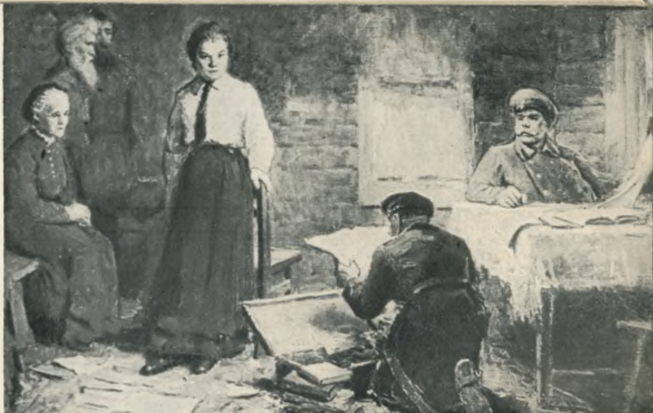
Обыск на квартире М. И. Ульяновой. Репродукция с картины М. А. Ларичева.