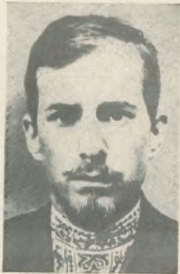
А. В. ЛУНАЧАРСКИЙ