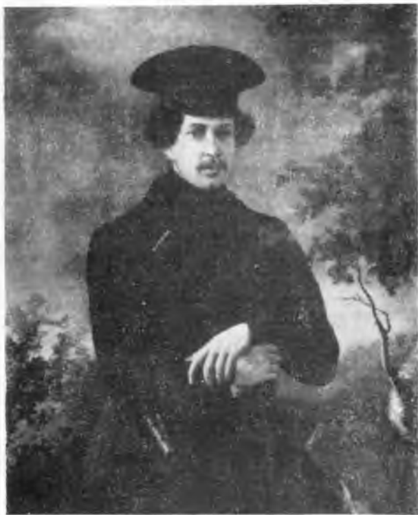
Портрет С. А. Зубова. Ок. 1843.

ют портреты из Государственного Русского музея, Вологодского краеведческого музея, Вологодской картинной галереи, Череповецкого краеведческого музея. Не охватывая в полной мере портретное искусство художника, выставка несомненно вызовет интерес к личности и творчеству этого автора.