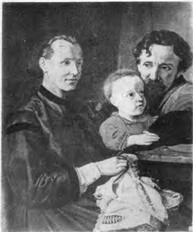
Семейный портрет. 1868.

Платон Семенович Тюрин родился 7 ноября (по старому стилю) 1816 года в селе Архангельском Богтютюгской волости Вологодского уезда (ныне Сокольский район Вологодской области) в семье крепостного крестьянина Семена Андреевича Тюрина. В 1843 году, получив вольную от помещика А. А. Холмова, Платон Тюрин уезжает в Петербург и поступает в Академию художеств. В 1850 году он получает звание неклассного художника, а в 1857 году удостоивается звания акаде-