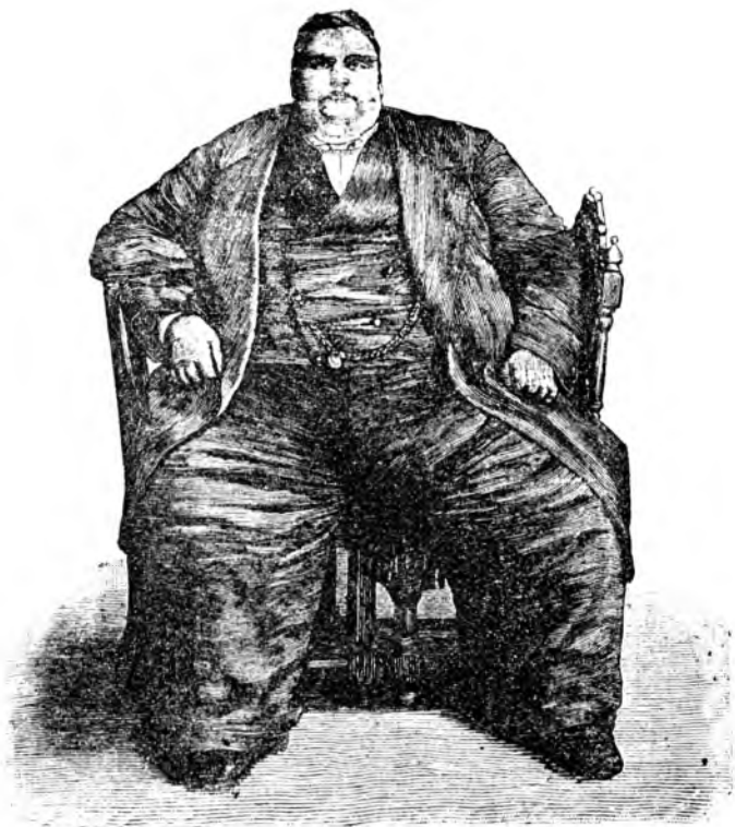
Фиг. 5. Тучный субъектъ, 17 пуд. вѣса. (по Киршу).

вается. Пищевареніе нарушается. На сцену выступаютъ цѣлый рядъ такихъ припадковъ, которые угрожаютъ не только здоровью, но и жизни больного.