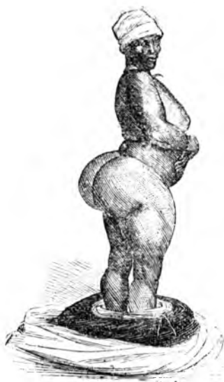
Фиг. 4. Чрезмѣрное отложеніе жира на ягодицахъ (по Кириу ).

Это отложеніе, по мнѣнію всѣхъ наблюдателей, начинается съ самаго ранняго періода жизни. Подобное явленіе имѣетъ мѣсто у бушменокъ, хотентотовъ и другихъ.