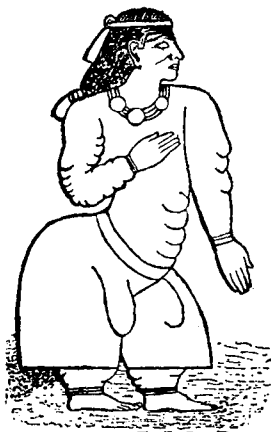
Фиг. 1. Изображеніе арабской царицы (на камнѣ).

Рисунокъ, (см. фиг. 1) правда, исполненъ да