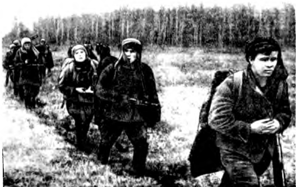
Партизаны в походе.