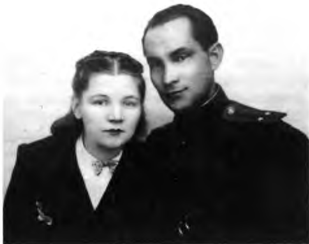
Последняя встреча в Вологде

что изначально планировали самостоятельно освободить Польшу. Известно, что «АК-овцы», направляемые британскими спецслужбами, препятствовали продвижению Красной армии на запад, ведя подрывную деятельность в ее тылу, вплоть до убийств советских солдат и офицеров». Это могли быть и националисты с Украины, отступающие с войсками фашистской Германии.