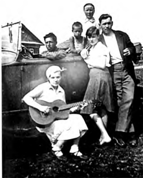
Поездка в Вологду (Высоково, 1934 г.)