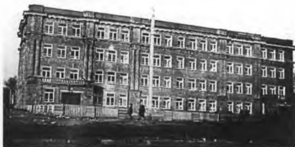
Школа № 19 (Архангельск, 1940 г.)