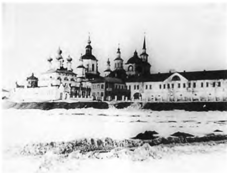
В. Устюг (Набережная)