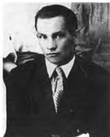
В семейном кругу