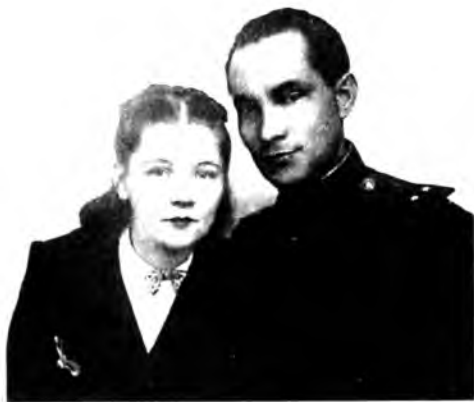
Последняя встреча в Вологде (январь 1945 г.)