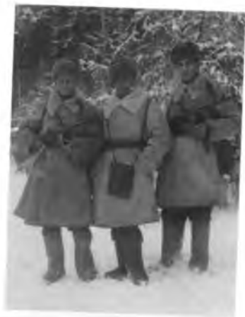
В лесах Карелии. 1944 г.