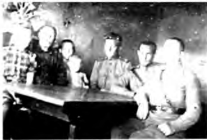
В гостях у местных жителей (Норвегия)