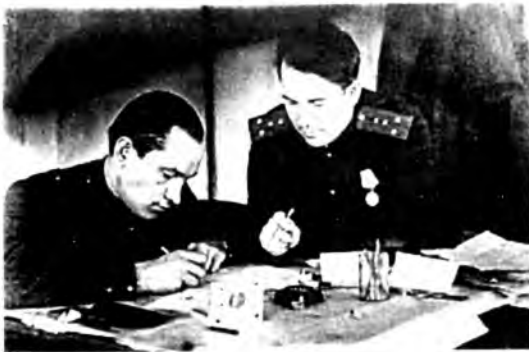
Работа в штабе (Польша)