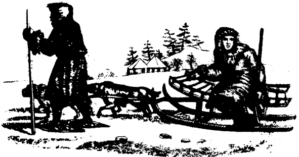
Сани и лыжи у камчадалов.