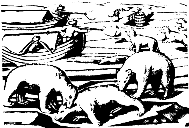
Охота на белых медведей.