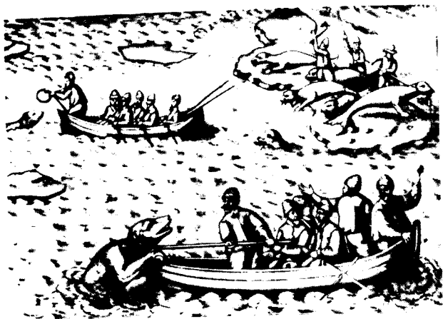
Охота на морского зверя.