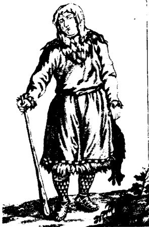
Коряк в простом наряде.