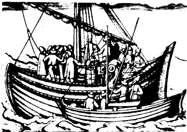
Плавание по северным морям в XVII веке.