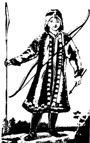
Якут в охотничьем платье.