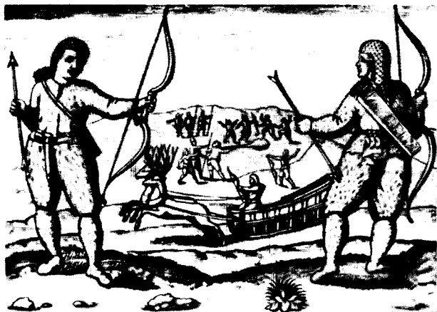
Народности русского Севера.