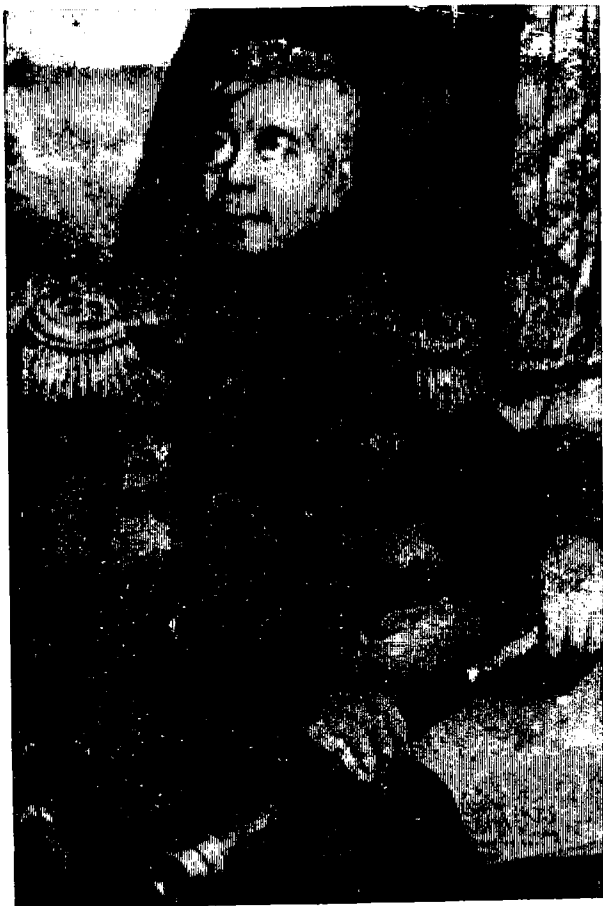
И. Ф. Крузенштерн.

ке. Именно поэтому Булдаков принимает личное активное участие в снаряжении и отправлении первой кругосветной экспедиции под командованием Крузенштерна 1) и Лисянского 2) на кораблях «Надежда» и «Нева».