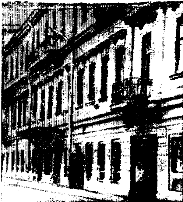
С.-Петербург, Мойка, 72, Правление Российско-Американской компании.