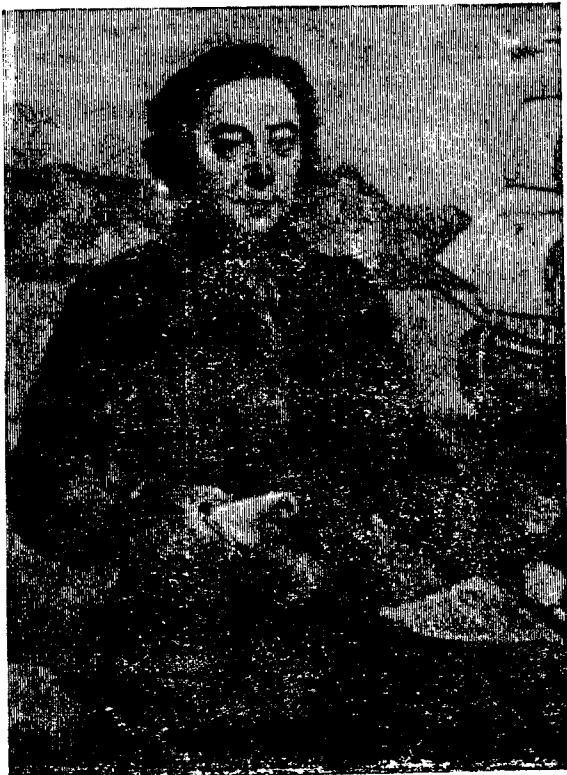
Г. И. Шелихов.

Поэт Гавриил Державин назвал Григория Шелихова «Колумбом Российским», а ныне благодарные потомки одному из городов Дальнего Востока дали имя «Шелихов». Григорий Иванович скончался 20 июля 1795 года в г. Иркутске на 48-м году жизни. Похоронен в Знаменском монастыре. Над могилой в 1800 году женой поставлен оригинальный мраморный памятник, изготовленный лучшими мастерами Екатеринбурга. Памятник украшен бронзовыми барельефами. На одной из сторон красуется надпись: