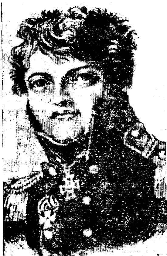
Ю. Ф. Лисянский.