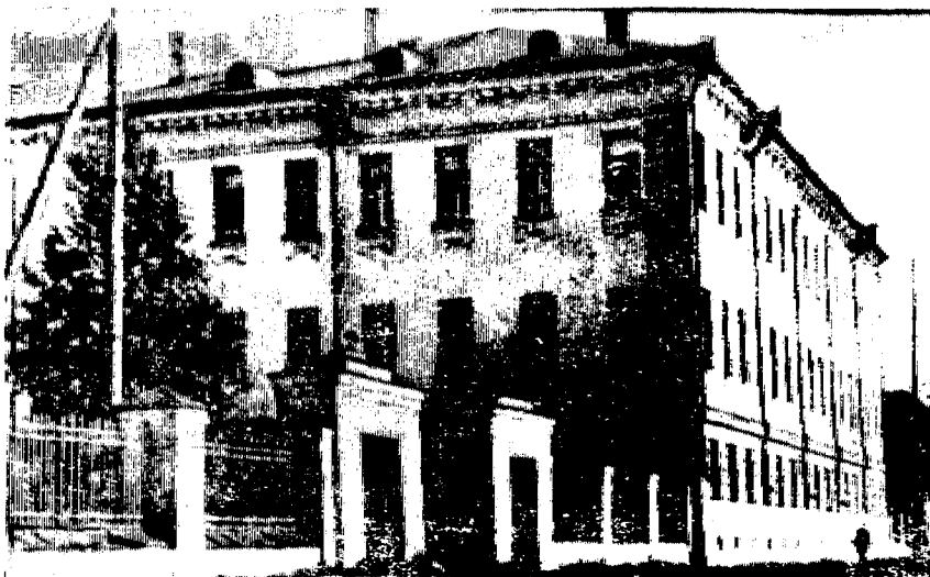
Современный вид дома М. М. Булдакова.

колонны в центральной части фасада, балкон по фасаду, а со стороны двора, несколько смещенно, пристроен трехэтажный корпус.