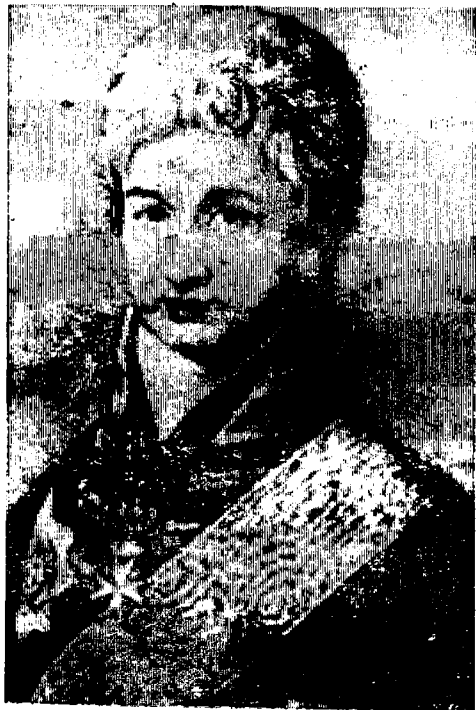
Н. П. Резанов.

Начальниками экспедиции были назначены И. Ф. Крузенштерн и Н. П. Резанов, возглавлявший дипломатическую миссию. Читателям будет интересно познакомиться с некоторыми фактами биографии Н. Резанова, обер-прокурора Сената и кавалера, человека необыкновенного, интереснейшей судьбы.