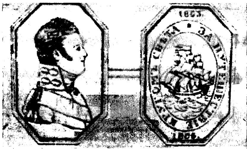
Медаль в честь первого русского кругосветного плавания 1803—1806 гг. на кораблях «Надежда» и «Нева».

лотую медаль, выпущенную специально в честь завершения первой кругосветной экспедиции. Золотая медаль на алой александровской ленте для ношения на шее за труды в трехгодичном плавании имела восьмигранную вытянутую форму, на одной стороне было изображение Александра I, на другой, во овале, трехмачтовый корабль, идущий в море под всеми парусами, и надпись: «За путешествия кругом света».