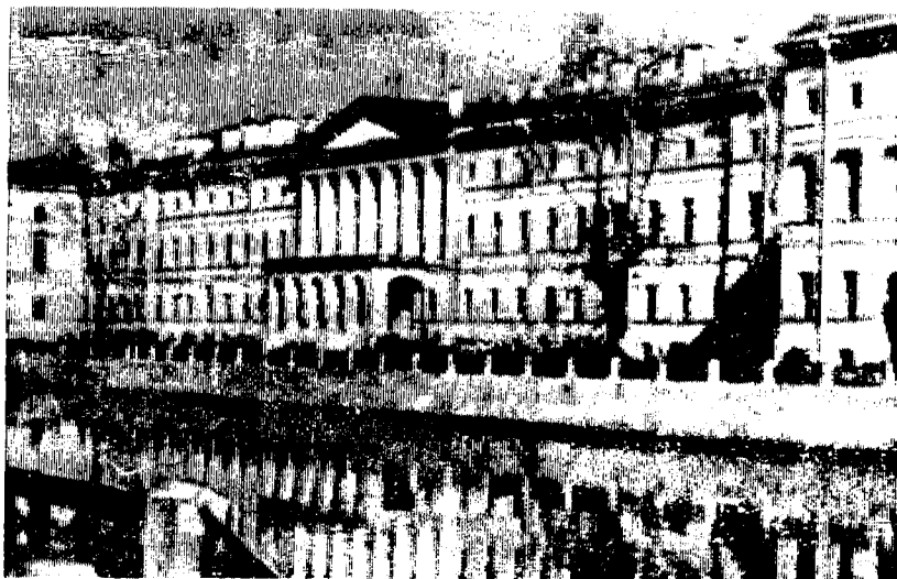
С.-Петербург. Екатерининский институт.

Все четыре дочери имели высшее образование, воспитывались в Екатерининском институте г. Петербурга.