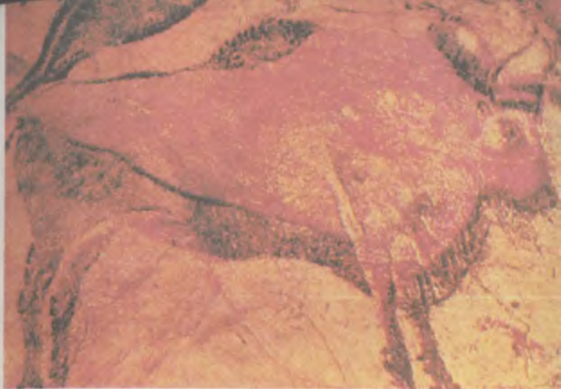
Изображение зубра на стене пещеры Альтамира в Пиренеях (эпоха неолита)