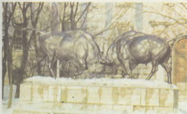
«...И вечный бой...» (скульптура в г. Калининграде)