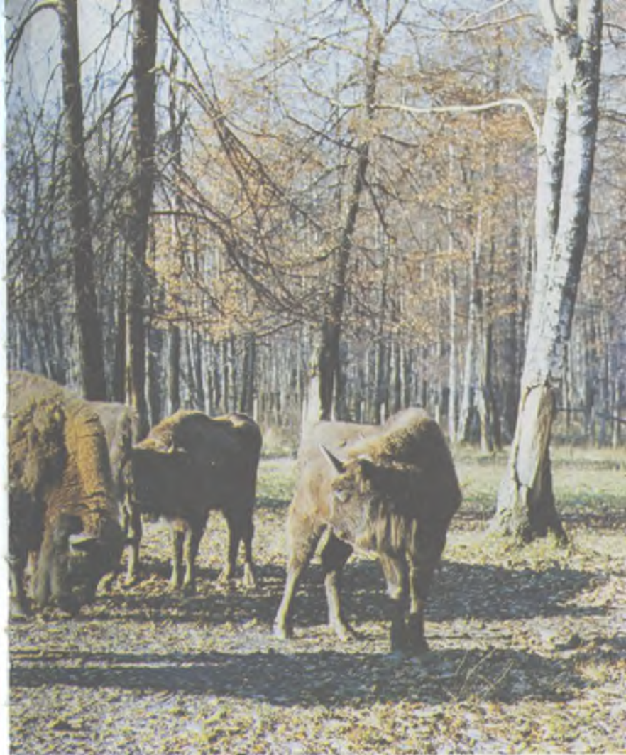
Зубрята от одного до трех лет объединяются в отдельные «молодежные» группы