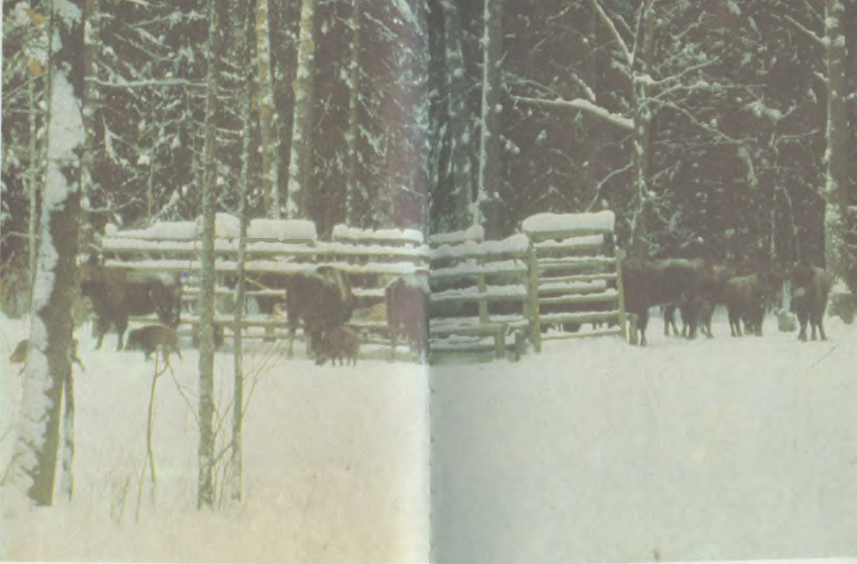
Кабаны изрядно досаждают зубриному племени своей назойливостью и прожорливостью