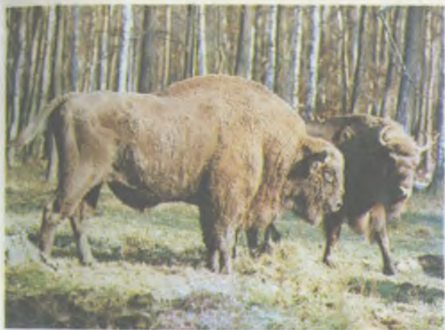
Кавказско-беловежские зубры — крупные звери с холкой рыжего цвета, без челки

◀ Парадный въезд в Центральный зубровый питомник