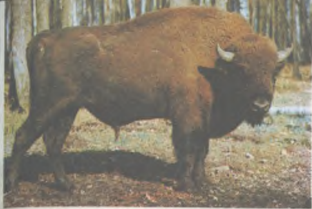
Кавказско-беловежский зубр Авел из Швеции