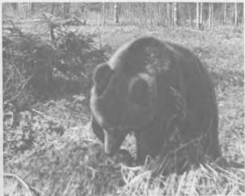
Раскапывая гнезда мышей, медведь задирает целые пласты дерна

Яшку нельзя было оторвать силой и приходилось обливать его водой. Видимо, характер у него был, хотя и скрывался за невзрачной внешностью и отсутствием должной силы.