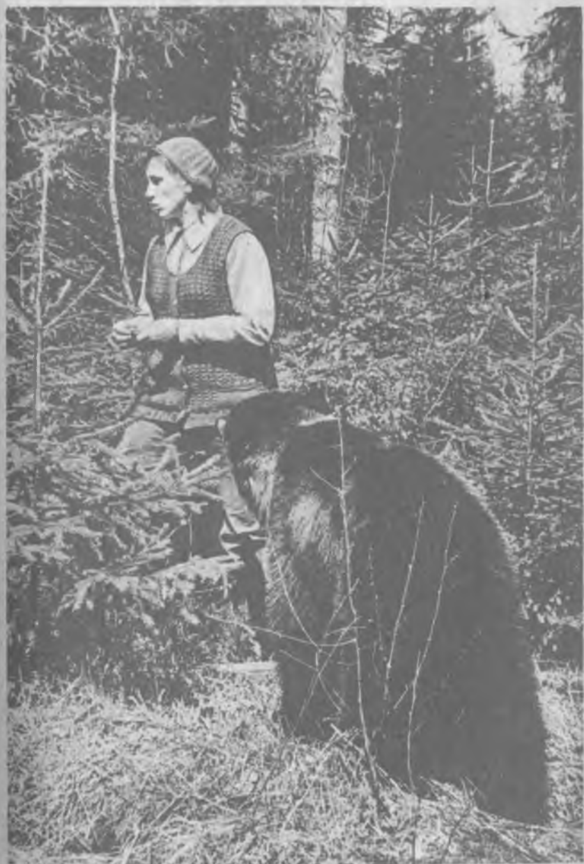
С повзрослевшим медведем нужно быть настороже.