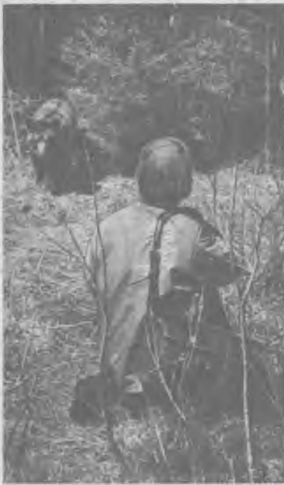
От такого объекта фотографии предпочитают держаться подальше

та начали питаться овсом как бы неумело, выбирая по одному зернышку, но день ото дня увеличивали его количество в пищевом рационе. На восьмой день их экскременты почти полностью стали овсяными. Так нам удалось установить временные границы переходного периода в питании медведей. Эта особенность пищевого поведения вполне укладывалась в наши представления, сложившиеся при наблюдениях за питанием диких медведей.