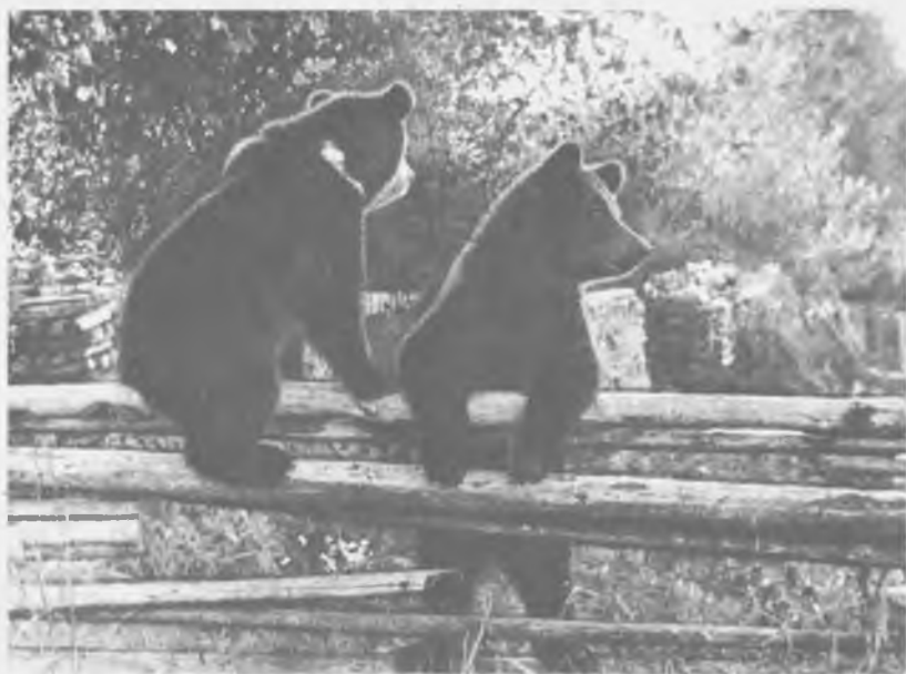
На деревенском заборе

светлые лужайки, искрятся на солнце веселыми зайчиками и снова прячутся в лесном сумраке. Водораздельные луга буйно зарастают травой, а на высоких кочках селятся муравьи. Эти места часто посещают медведи — повсюду можно видеть многочисленные следы их деятельности. Вот сорвана верхушка у болотной кочки — медведь лакомился муравьями, а чуть дальше выкопана ямка и рядом задраны целые пласты дерна — это он охотился на мышей. Здесь мы и остановились.