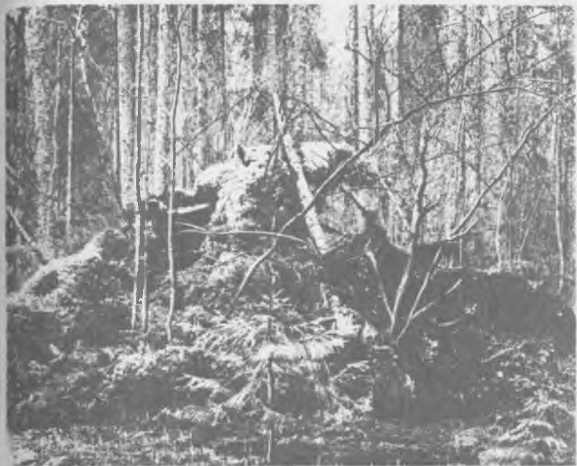
В старых захламленных ельниках летом медведи устраивают лежки

Был у нас западносибирский кобель по кличке Умка, с густой шерстью палевого цвета и черными, удивительно выразительными глазами. Пес этот оказался на редкость послушным в лесу, что вовсе не характерно для лаек, и был типичным берложником. Я ни разу не видел, чтобы он вскинул на медведя шерсть или сделал хватку. Зла на зверя у него не было. Найдя берлогу, он начинал звонко лаять, не подходя, однако, к ней ближе пяти — шести метров. Стоило подать команду, и пес послушно шел на поводок. Много берлог нашла эта собака, оказывая нам неоценимую помощь в работе.