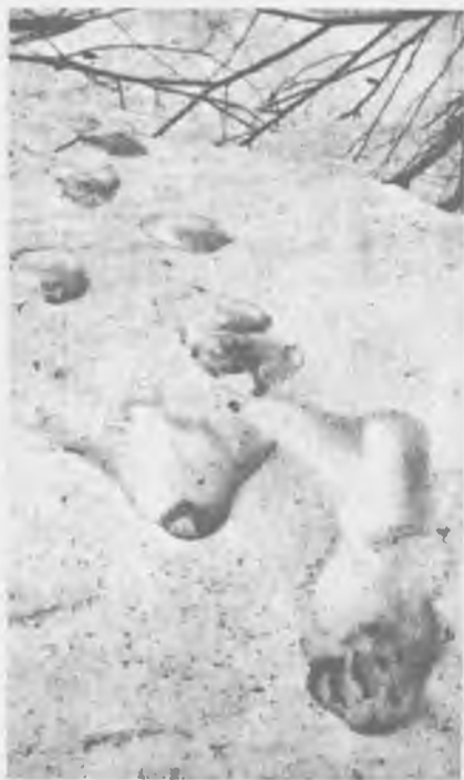
Весной уходят медведи от своих берлог, разгребая подтаявший снег

ней — начинал им жонглировать, поворачивая во все стороны. Я замечал, как несколько раз мишки грызли молодую кору рябины, а однажды видел, как они на щепки разгрызли ветку лещины толщиной около четырех сантиметров.