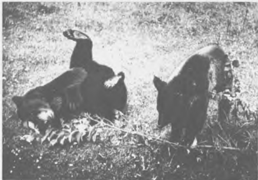
Игры бывают разные

царапать, ломать, хватать за что попало еще не вооруженной мощными зубами пастью. Я кинулся отбивать козленка, на помощь мне подбежал человек. Через минуту я уже поспешно уводил возбужденных, фыркающих и рвущихся в атаку медвежат. Козленок принадлежал одному из сотрудников заповедника, был ручной и часто сопровождал его в лесу. В момент нападения поведение медвежат было похоже на игру, но отдельные движения, азарт и возбуждение их показывали — игра эта особенная. Позже я уверился в том, что медвежата именно напали на козленка, как на добычу, когда наблюдал за поведением полугодовалого медвежонка, поедавшего павшего теленка. Он все время старался сломать, смять, порвать, проташить свою добычу — это были те же самые движения, что я видел у моих мишек, когда они напали на козленка.