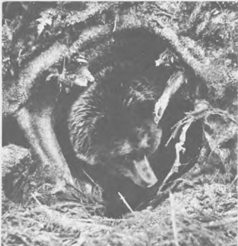
Берлога — это важно

дни и однообразное поведение медвежат тянулись, казалось, бесконечно долго. Двадцать восьмого октября я пришел домой, чтобы привести себя в порядок и запастись провизией. Впереди был еще целый месяц неизвестности — в берлогу медведи ложатся в конце ноября.