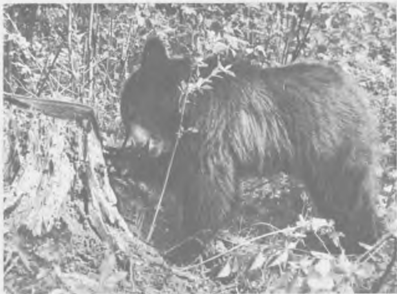
В старом трухлявом пне всегда можно чем-нибудь поживиться

клетки, и травянистая растительность не могла занять основное место в их пищевом рационе. Однако голод — не тетка, и малыши вынуждены были что-то промышлять. С каждым днем они все больше осваивались в лесу. Не забывали и поиграть, но большее время дня у них уходило на разыскивание пищи. В их поведении преобладала поисковая реакция пищевого поведения. Они рыскали по сторонам, переворачивали гнилушки, небольшие камни, ковырялись в моховых кочках, добывали муравьев, ели траву. Наивысшая пищевая активность наблюдалась утром, часов до одиннадцати, и вечером, в пять-шесть часов. В середине дня малыши укладывались спать в различных положениях — кто на живот, кто на бок — и прикрывали от комаров свои носы лапой. Я же довольствовался мазью «Тайга», хотя иногда приходилось пользоваться и деметилфталатом — он понадежней.