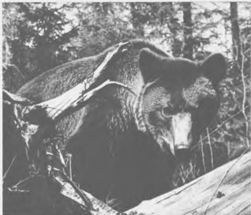
Поздно осенью уходит медведь в места, где построит берлогу

нюхали и осмотрели следы кормившегося здесь медведя, походили по его кормовой площадке, а потом уселись и начали деловито поедать овес. Профессор с удовольствием щелкал затвором аппарата, восхищался движениями медвежат, их умением «сцеживать» зерна с метелки, почти ничего не оставляя на стебле.