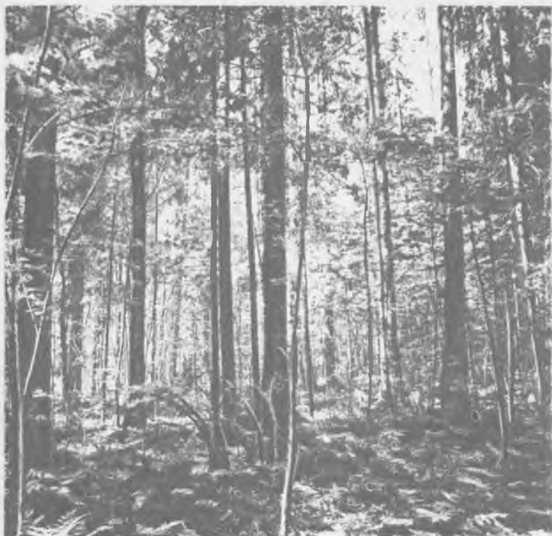
Труднопроходимые дебри старого заповедного леса — медвежье царство

Пользуясь тем, что медведи приходили в такие места еще задолго до выпадения снега, я еще с осени старался определить занятость некоторых участков, осторожно пробираясь по звериным тропам и разгадывая медвежьи следы. Несколько дней кропотливой работы с бесконечными обходами подозрительных мест, осмотром троп, дорог, намытых дождями песчаных кос по овражкам и ручьям позволяли предположить возможное размещение медвежьего дома. Если такой работе сопутствовала удача и в один из очередных обходов зверь не обнаруживал за собой слежки, то зимой, внимательно проверив с собакой несколько осенних окладов, мы находили берлогу. Лайка — верный помощник при ее разыскивании. Но если в охоте на медведя особо ценятся медвежатницы, делающие крепкие хватки по зверю и останавливающие его, то для отыскания берлоги нужна иная, более мягкая, но вязкая и настойчивая собака — берложница, которая, отыскав ее, не нападает на зверя, а ровно и ритмично лает и хорошо отзывается на команду. Под такой собакой медведь лежит и если осторожно отозвать лайку, не сходит с берлоги.