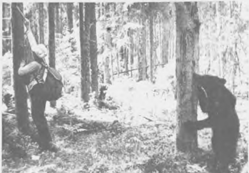
«Медвежьи метки» каждого интересуют по-своему

треском ломая попадающиеся на пути сухие сучья. Ни Катя, ни Тоша участия в игре не принимали, хотя Яшка дважды каждого из них приглашал, прыжками подступаясь к ним и расквашивая головой. Но вот мы пришли на черничник — и медвежата притихли, занялись сбором урожая.