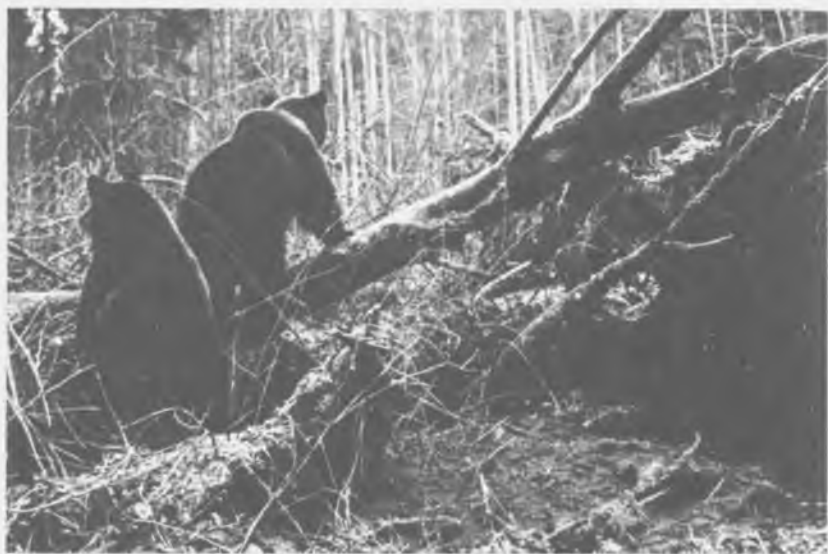
Первый снег заставляет искать укрытия

Так я хотел зарегистрировать активность медвежат в период их зимнего сна. Всю площадку огородил вольерной сеткой, опасаясь случайного захода в это место собак. Наконец, установил в семи метрах от «берлоги» палатку и прорезал в ней окно для наблюдений за поведением мишек. Теперь оставалось только ждать положенного времени.