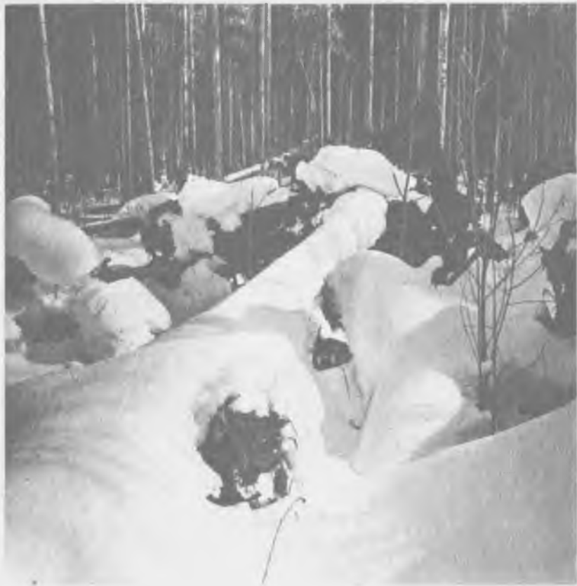
Под упавшими стволами старых деревьев, заваленных снегом, прячется берлога медведя зимой.

головой к челу; не приближались мы к берлоге и ближе 30 метров, а при подходе к ней пользовались различными укрытиями. При этом учитывались также сила и направление ветра и еще многие другие мелочи, которые могли бы повредить делу. В первый год работы мне удалось отыскать пять берлог, однако две из них сразу же опустели, потому что медведи меня увидели и, конечно, удрали, зато в трех остальных они остались лежать, и я имел возможность посмотреть весной на их следы и «квартиры», а одного медведя даже видел лежащим у самой берлоги.