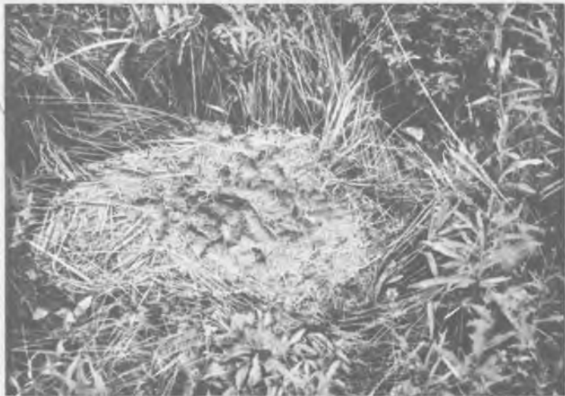
Рядом с овсяным полем можно увидеть лежки медведей

высоких моховых кочек, то вновь появлялся, обретая русло. В ручье медвежата купались, плавали в небольшой бочажинке, поднимая со дна черную торфяную муть, а потом грелись на солнышке, растянувшись на моховой перине.