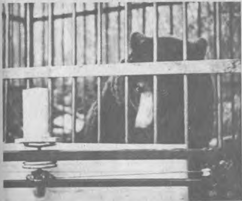
Медведь решает задачу