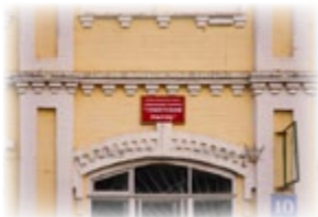
Редакция газеты «Советская мысль»