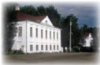
В этом доме родился Ал. Круглов, писатель-этнограф