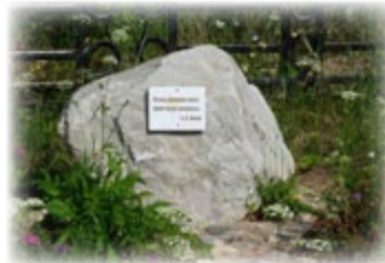
Памятный камень на месте бывшей деревни Анциферова Курья - родины писателя»