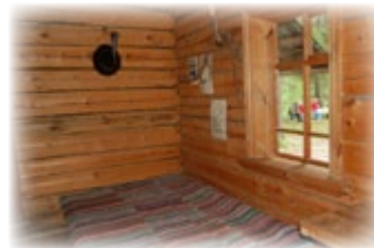
Ландшафтно-мемориальный заказник Бобришный Угор

На Бобришном Угоре Воздух свеж, будто в море, Родниковые зори, И ни с кем я не в ссоре. Ни заповров не надо, Ни замков, Ни ограды. Добрым людям избушка Круглый год будет рада.