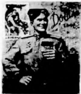
КРАСНОЙ АРМИИ -СЛАВА!

О вкладе устюжан в общенародное дело Победы, их героизме и мужестве. Это они пол-Европы прошагали, пол-Земли, приближая Победу. Они упорно шагали вперед, оставляя за собой могилы своих дорогих товарищей, они под шквальный огонь форсировали Неву и Северный Донец, Днепр и Буг, Неман, Вислу и Дунай – до Эльбы. Это от их крови таял снег. Они гнали врага от Москвы, Сталинграда и Ленинграда, освобождали Киев и Одессу, штурмовали Берлин и водрузили там Знамя Победы.