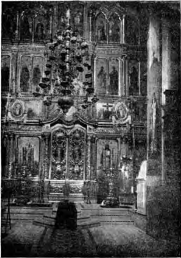
Иконостасъ Троицкаго соборнаго храма монастыря.

изящному рисунку, въ византійскомъ вкусѣ; весь вызолоченъ червоннымъ золотомъ по полименту; иконы его новыя фряжской работы; стоимость простирается свыше 4000 руб. Алтарь троечастный, съ отдѣле-