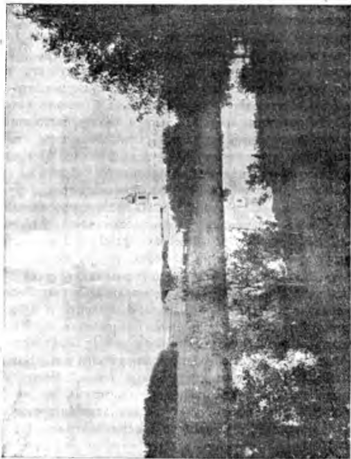
Павло-Обнорскій монастырь съ юго-западной стороны.

всесторонней разработкѣ исторіи управляемаго имъ монастыря. И дай Богъ, чтобы это доброе дѣло, имъ начатое, какъ приносящее несомнѣнно духовную пользу народу русскому, не останавливалось здѣсь, ширясь, и умножаясь, и принося духовный плодъ, ово въ шестьдесятъ, ово во сто, ово-же въ тридцать!