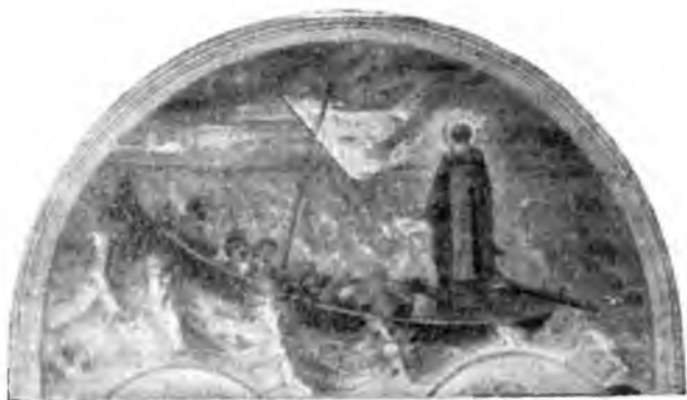
Спасеніе утопающихъ преподобныхъ на Сѣверной Двинѣ.

«Соблюдайте введенный уставъ и порядокъ и послѣ отшествія моего, говорилъ онъ. Церковнаго чина службу творите безъ лѣности, съ благоговѣніемъ и умиленіемъ; ибо подобаетъ Богу служить со страхомъ и трепетомъ. Стоя въ храмѣ Божіемъ, почитайте себя стоящими на небѣ, моля Бога о своихъ грѣхахъ и объ умирении всего міра. Въ кельяхъ молитесь, прилежите рукодѣльямъ и Божіимъ книгамъ. Сохраняйте общій миръ въ обители, почитая каждого брата честью выше себя. Пищу и питіе нематежное имѣйте и противословія удаляйтесь, обуздывая языкъ свой. Пьянственнаго питія, молю васъ, и запрещаю, никогда не имѣйте, дабы не прогнѣвать Бога и не разрушить весь монастырскій уставъ. Если пребудете въ страхѣ Божіемъ, Господь не лишитъ благихъ Своихъ мѣсто сіе, и ни въ чемъ недостатка оно терпѣть не будетъ. И самъ я, если обрѣгу дерзновеніе предъ Богомъ, буду и тамъ молиться за васъ и за монастырь, да будете благоуспѣшны. Если бы кто нарушилъ уставъ общежитія, изгоните такового: подобаетъ бо намъ отъ таковыхъ удаляться, подражая благоугождающимъ Богу. Въ такомъ устроеніи помощникомъ себѣ имѣть будете Господа. Если кто несправедливо терпѣть, надѣйся на милость Божію. Грѣшенъ будетъ, пусть молится, и простится ему. И если кто потрудится и потерпѣть въ семъ пустынномъ мѣстѣ, то хотя-бы и грѣшенъ былъ, получить отъ Живоначальной Троицы оставленіе и милость, только-бы не ослабѣвалъ въ своемъ подвигѣ и претерпѣлъ до конца».