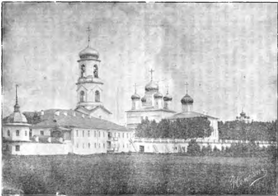
Видъ Павло-Обнорскаго монастыря.