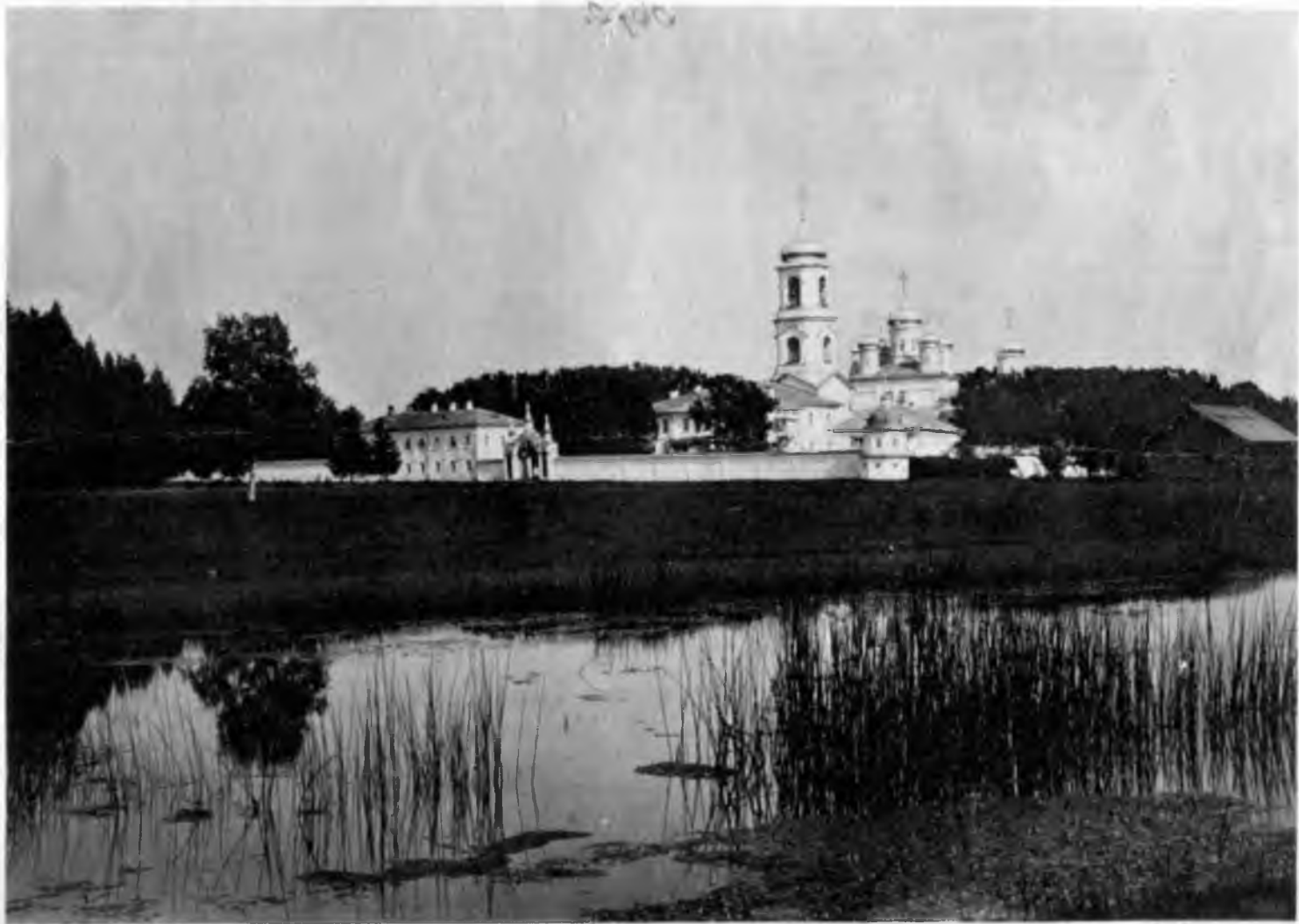
Видъ Павлова Обнорскаго монастыря Вологодской епархіи.