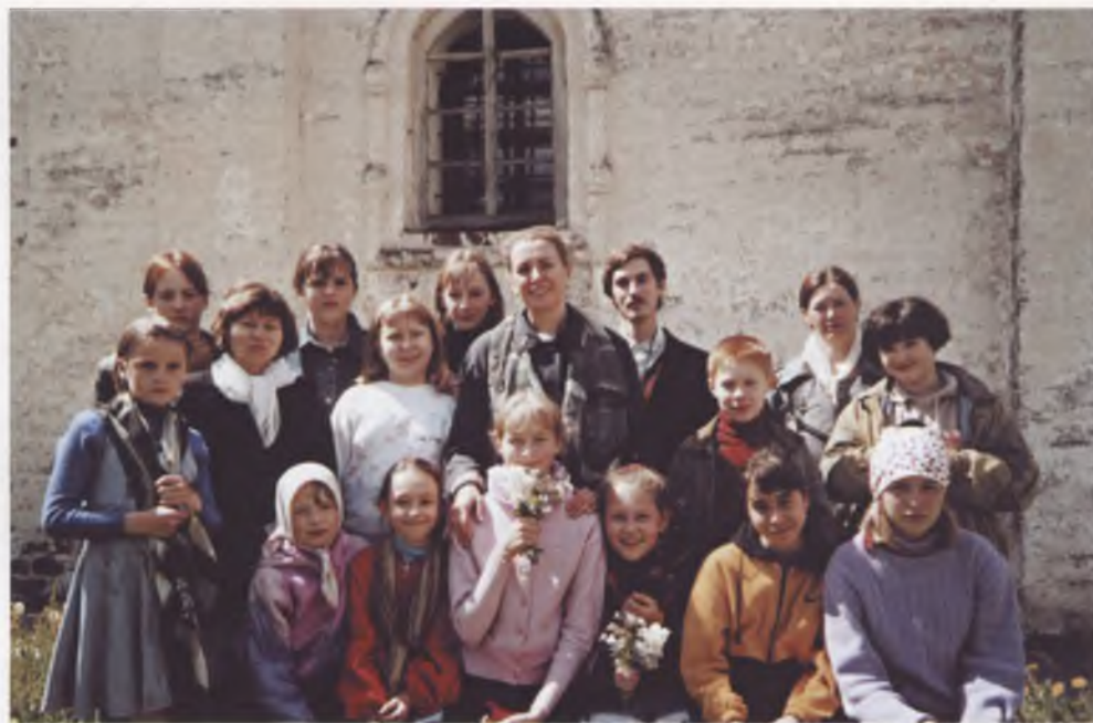
Паломническая поездка воскресной школы в Кирилло - Белозерский монастырь.