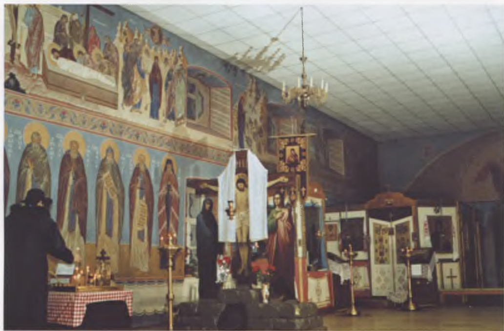
Настенные росписи храма (северная стена).