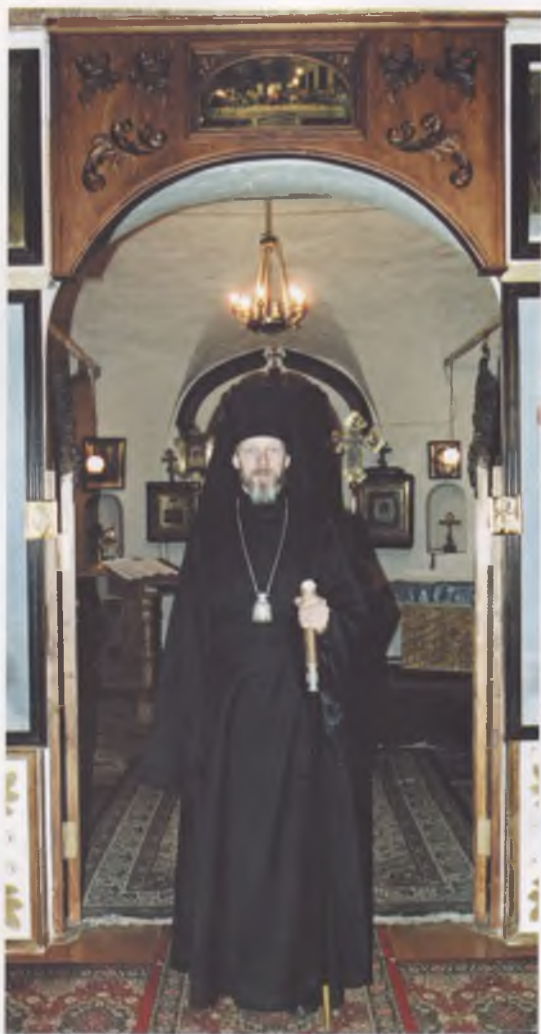
Епископ Вологодский и Великоустюжский Максимилиан у царских врат храма Неопалимой Купины.