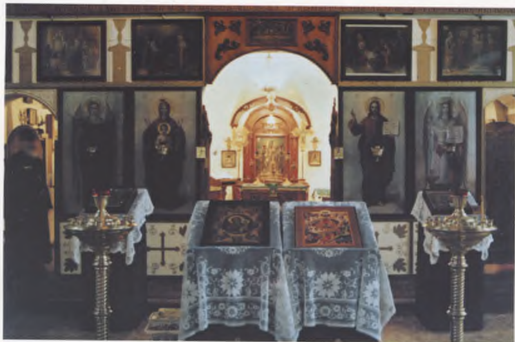
Храм Неопалимой Купины.