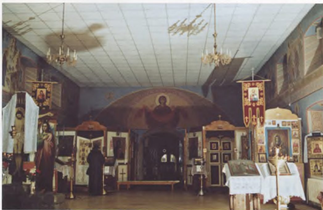
Покровский и Антипьевский приделы.