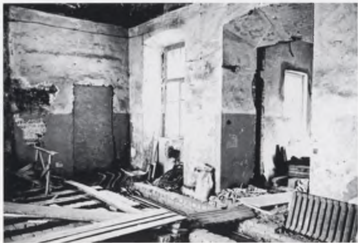
Внутренний вид церкви, 1980-е годы.

Мы собирались по субботам к девяти часам утра, а расходились около полудня. Работы был непочатый край, и трудящихся на храме подчас точили сомнения: справимся ли? Но как пчела помалу собирает мёд, так и кропотливый труд на храме приносил благие плоды. Было трудно разбирать утеплённое шлаком перекрытие в трапезном храме,