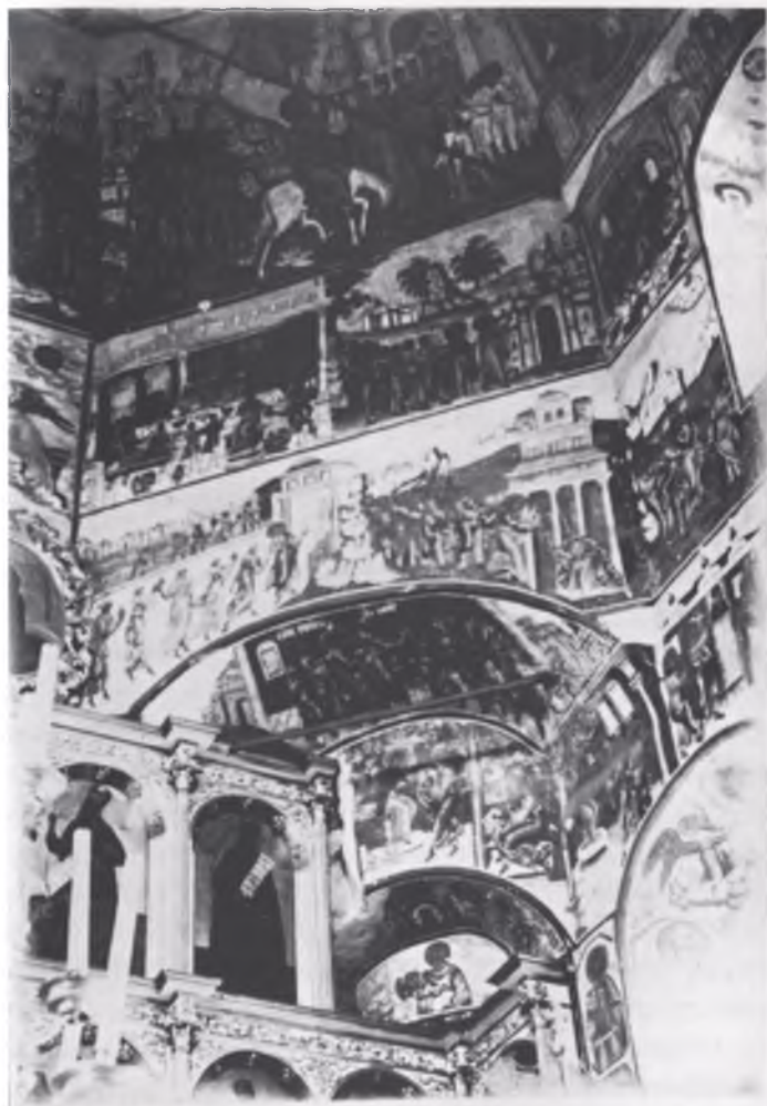
Юго - Восточный угол храма Неопалимой Купины. Фото начала XX века.