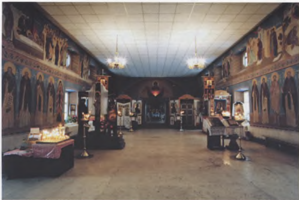
Внутренний вид Покровского храма.