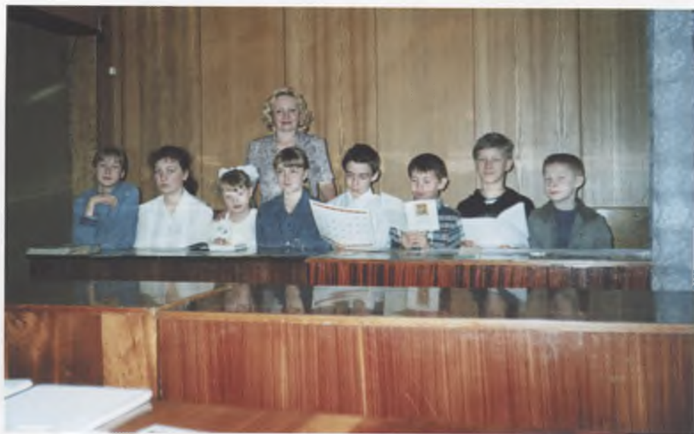
Детская воскресная школа Покровской церкви.