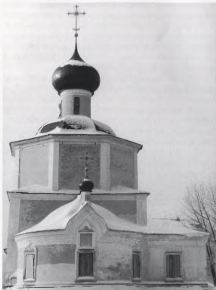
Внешний вид церкви в 1987 г.