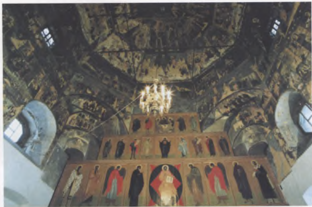
Иконостас храма Неопалимой купины.