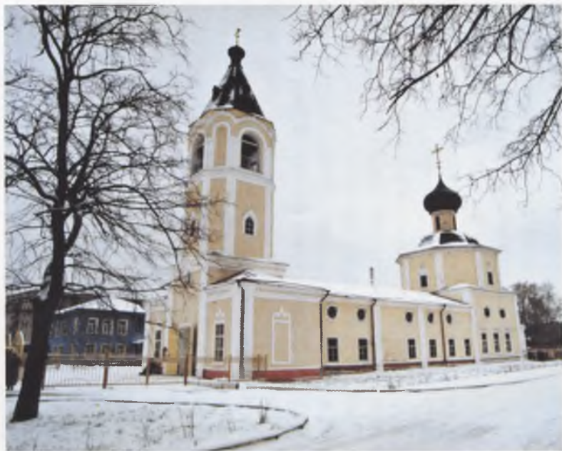
Покровская церковь в наши дни 2000 г. *

* - все последующие фотографии сделаны в 2000 году.