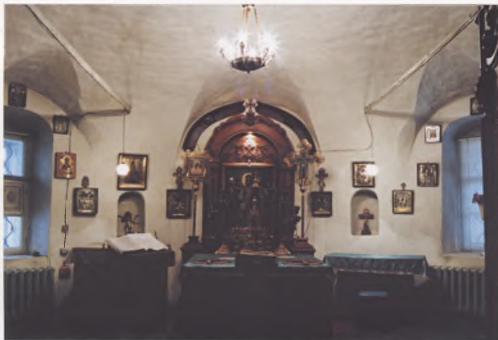
Алтарь храма Неопалимой Купины.