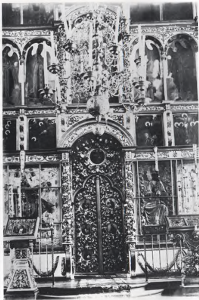
Царские врата и иконостас храма Неопалимой Купины. Фото начала XX века.