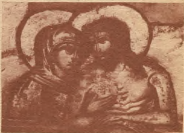
«Не рыдай мене, мати». Фрагмент композиции

Судя по первой монастырской описи 1601 года, в Успенском соборе, помимо иконостаса, помещалось очень много икон в киотах, висели пелены с лицевым и орнаментальным шитьем, стояли «тощие» свечи, было пять паникадил. Примечательно, что на правой стороне от царских дверей стоял «образ Пречистые Богородицы одегитрия чудотворной... что явилась чудотворцу Кирилу». Здесь же, в местном ряду, среди прочих икон были «образ Кирила чудотворца» и «образ Пречистые Богородицы воплощение со архангелы да Кирил чудотворец».