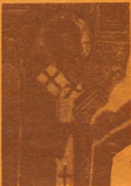
Святитель. Фрагмент композиции «Покрова Богородицы»