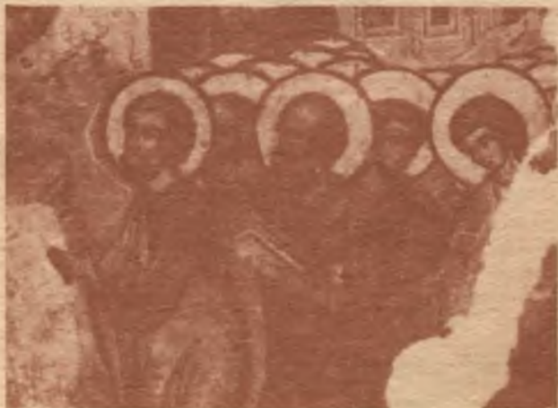
Группа праведных из композиции «О тебе радуется»

Успенский собор — традиционное для своего времени четырехстолпное трехапсидное сооружение из кирпича, стены которого разбиты на три части плоскими лопатками. Первоначально каждый фасад завершался тремя закомарами, над которыми поднимались еще два яруса кокошников. Все это увенчивалось массивным барабаном