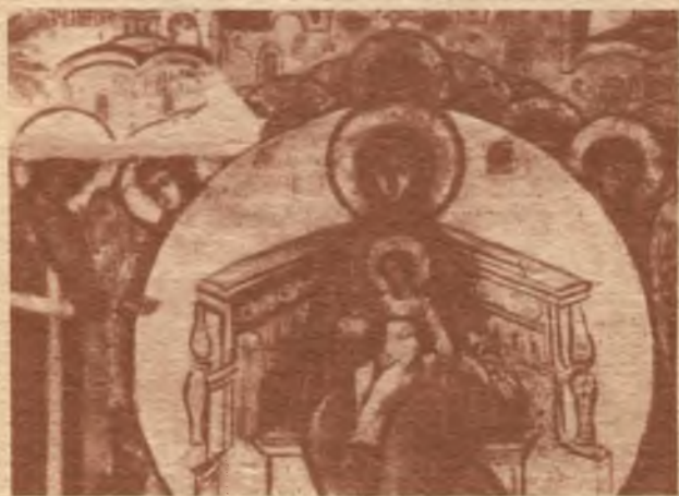
Центральная часть композиции «О тебе радуется»

Этот текст тропаря Нерукотворному Спасу помещен не случайно: празднование Нерукотворному Спасу отмечается на следующий день после Успения Богородицы. Таким образом, уже в барабане Успенского собора, где еще нет изображений Богородицы, намечается сокровенный переход от Спаса к богородичной теме — ведущей в росписи. Сюжетный цикл, повествующий о жизни Богородицы, основывается на различных литературных источниках: начинается по «Первоевангелию Иакова», продолжается по первым песням «Акафиста Богородицы», а завершается по «Слову Иоанна Богослова об Успении Богородицы». Чтобы последовательно просмотреть весь цикл, зритель должен сделать четыре круга в центральном пространстве храма, начиная справа от иконостаса и двигаясь по ходу солнца. Богородичная тема не исчерпывается житийным циклом: в люнетах помещены